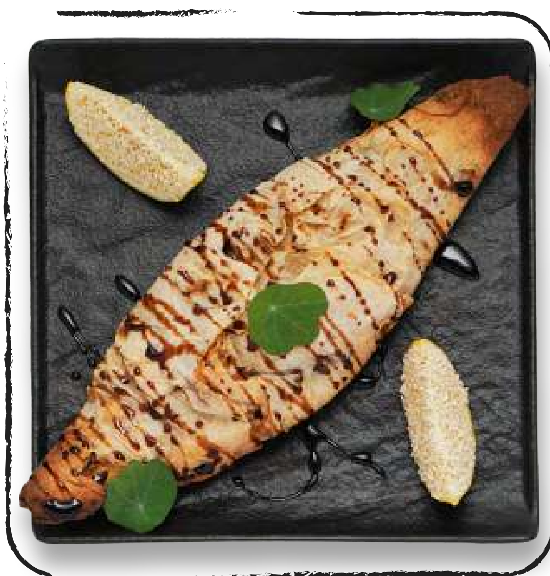
ФИЛЕ ФОРЕЛИ В ЛАВАШЕ