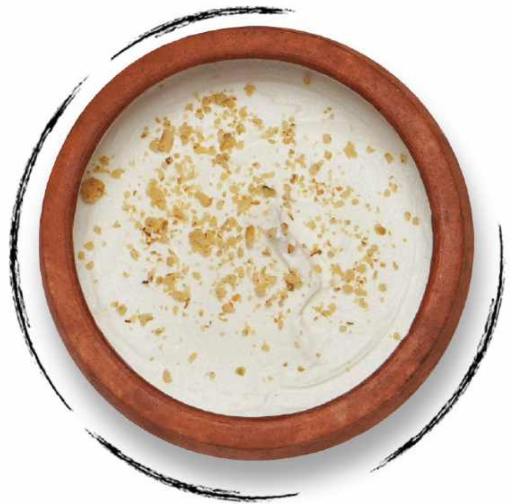
СЦЕЖЕННЫЙ МАЦОНИ (ЙОГУРТ) AMD 1700