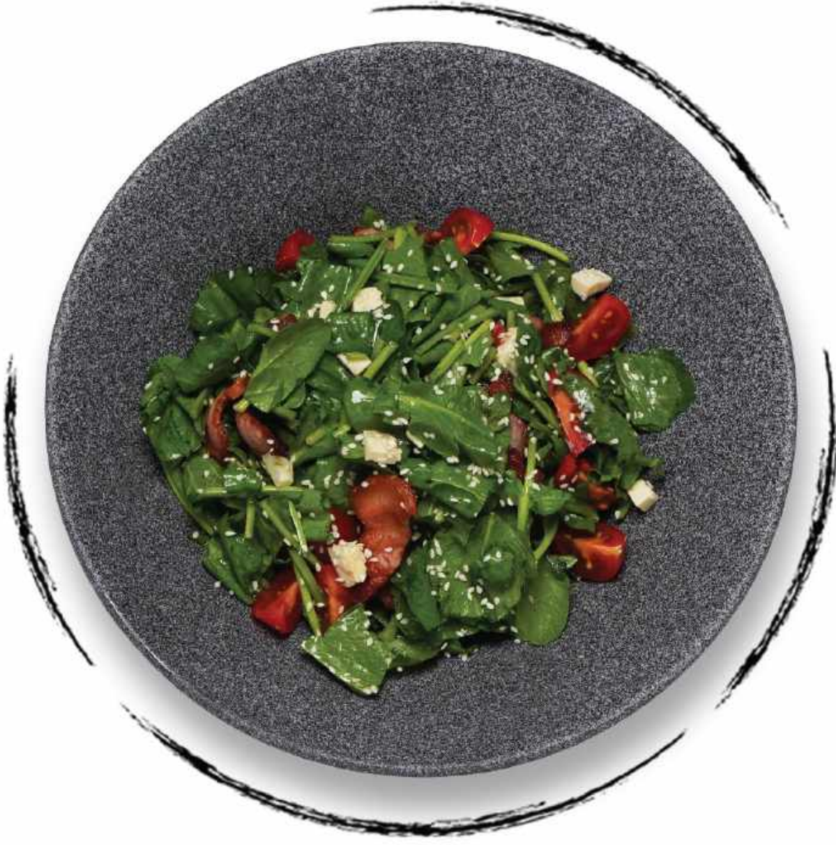
КРЕСС-САЛАТ С СЫРОМ РОКФОР AMD 3000