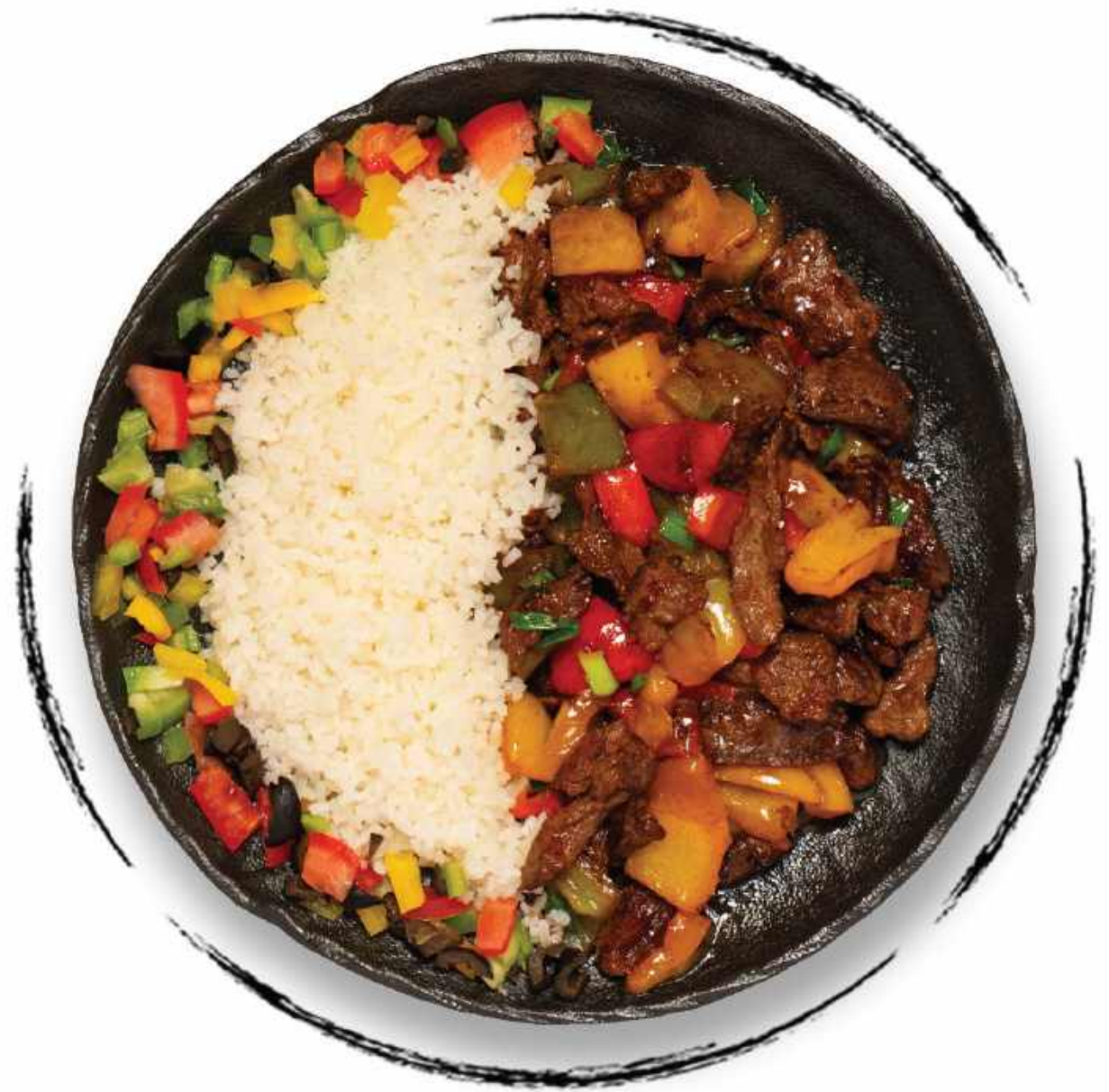
ТЕЛЯТИНА ПО РЕЦЕПТУ ШЕФ-ПОВАРА AMD 4500