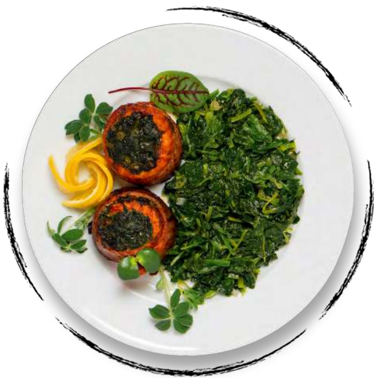
ФИЛЕ ФОРЕЛИ СО ШПИНАТОМ