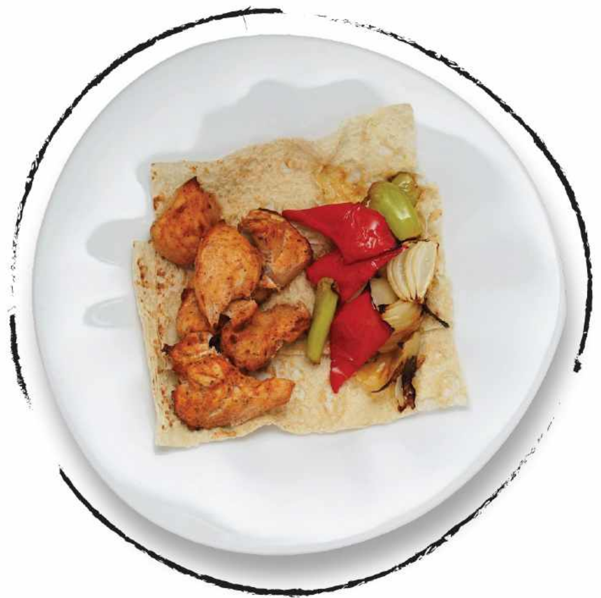
ШАШЛЫК ИЗ КУРИЦЫ