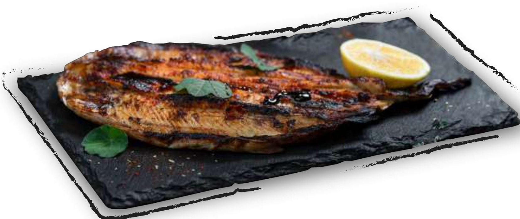
ШАШЛЫК ИЗ ФОРЕЛИ