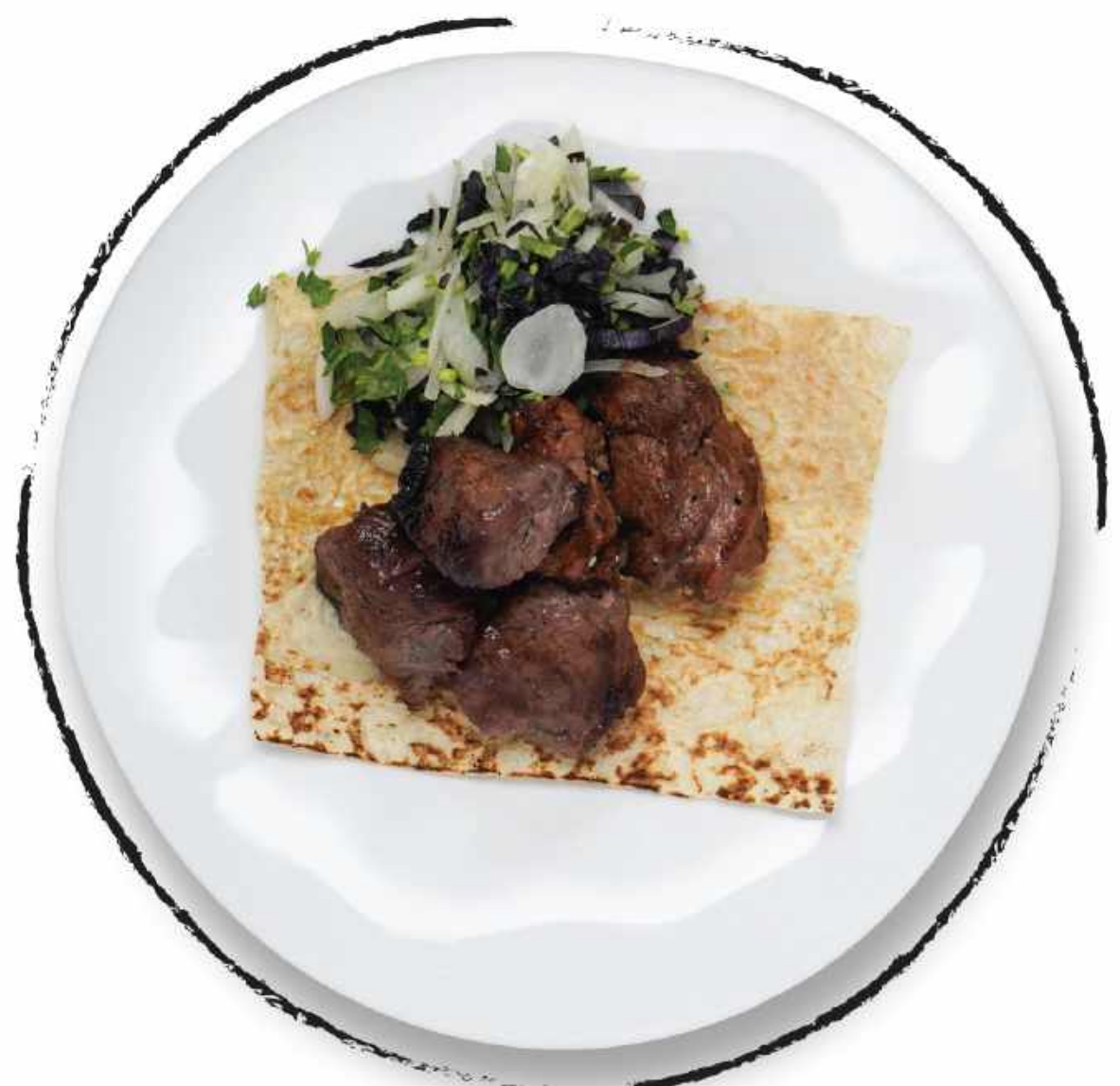
ШАШЛЫК ИЗ ГОВЯДИНЫ AMD 4700