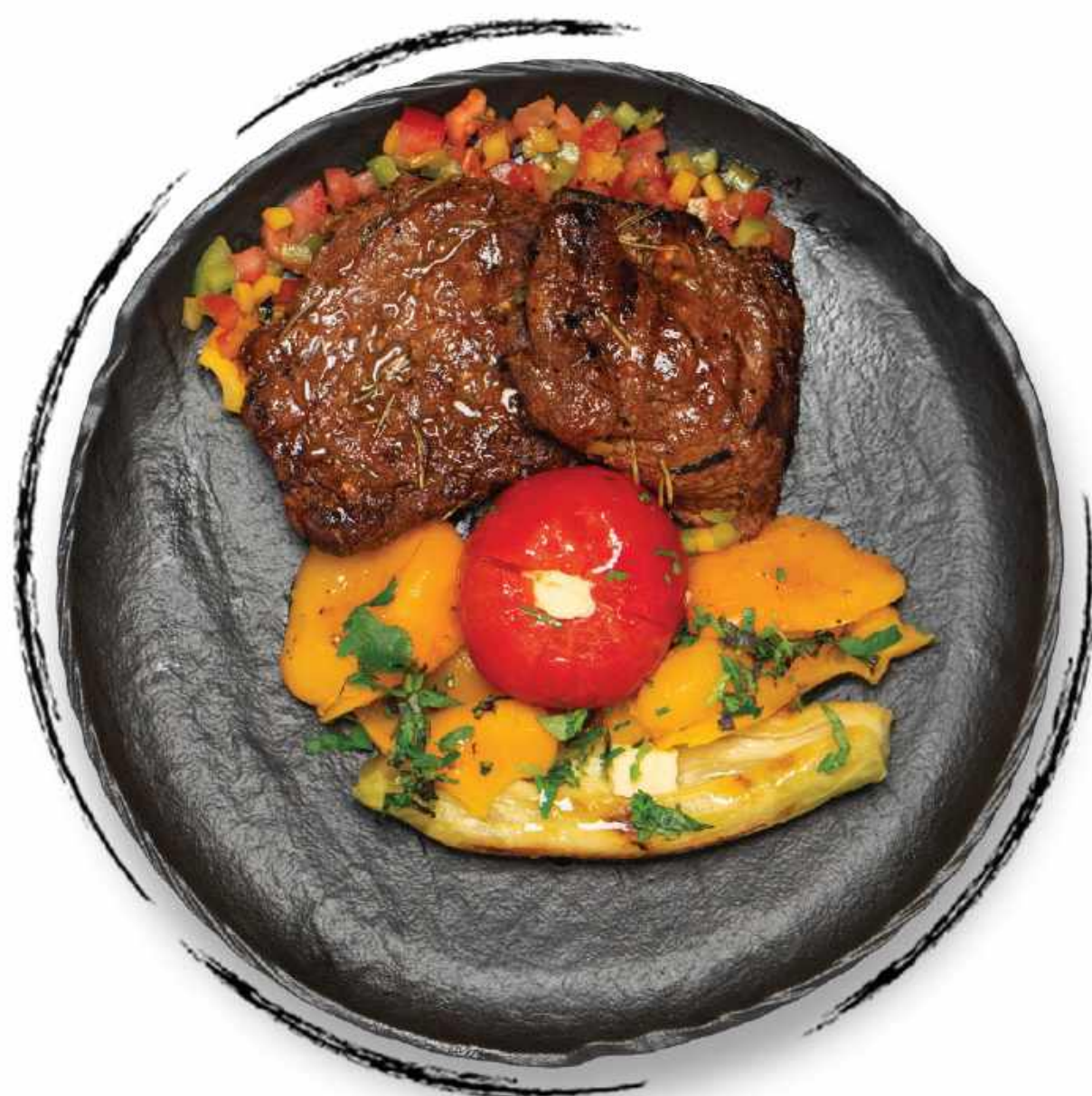
ЖАРЕННОЕ ФИЛЕ ГОВЯДИНЫ AMD 6200