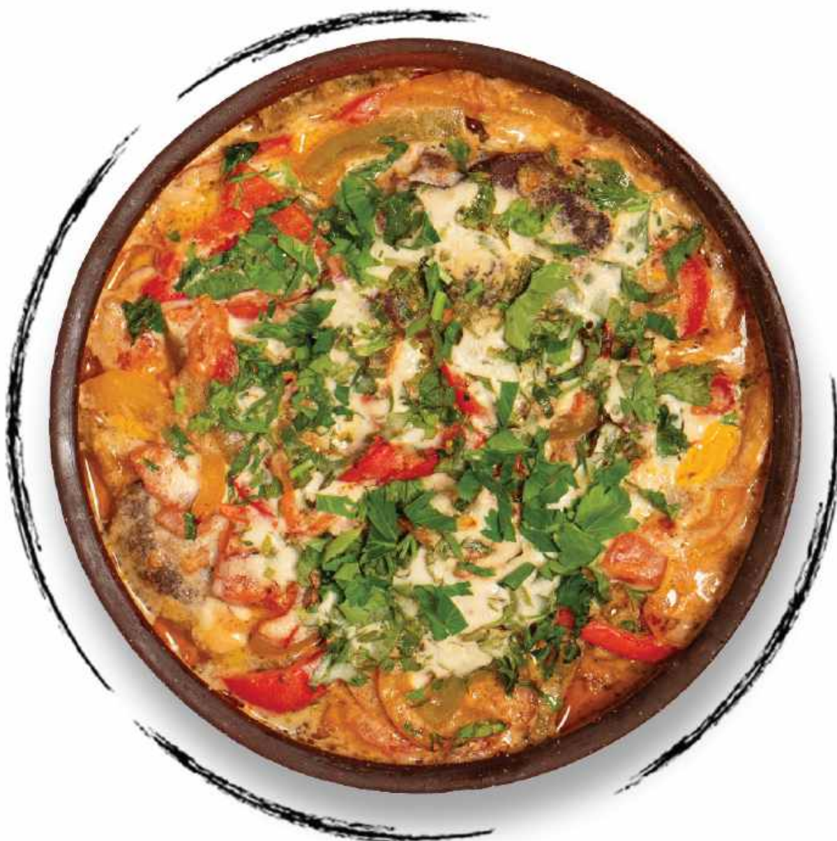
ТЕЛЯТИНА С ОВОЩАМИ И РЕЖАНОМ