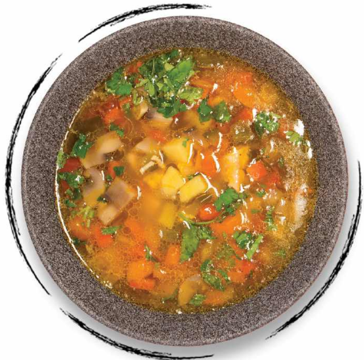
КУРИНЫЙ СУП С ГРИБАМИ AMD 2200