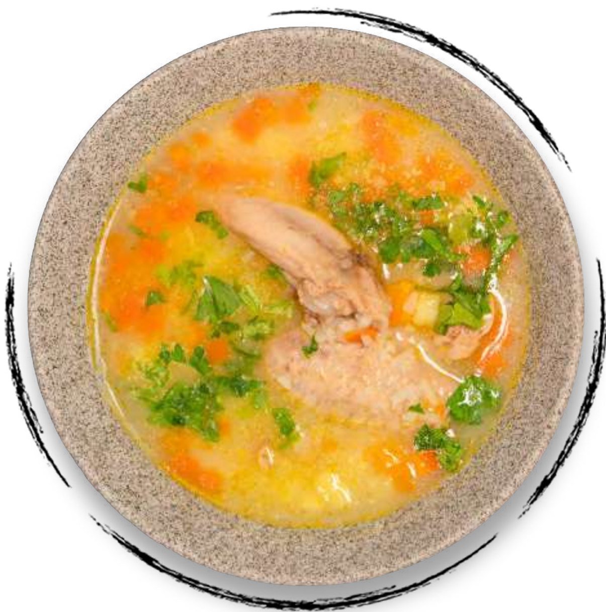
КУРИНЫЙ СУП AMD 2000