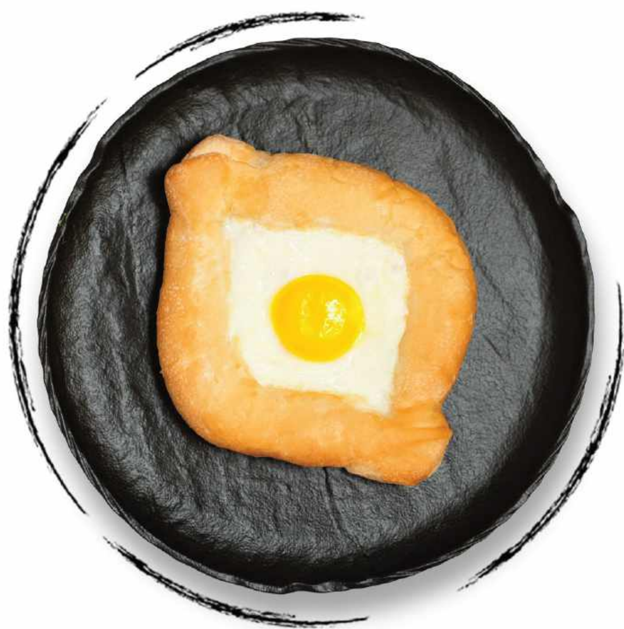
ХАЧАПУРИ ПО-АДЖАРСКИ AMD 2000