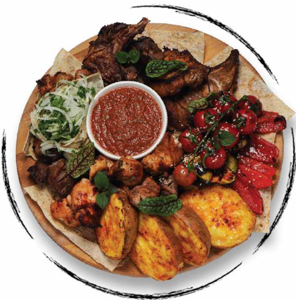
АССОРТИ ШАШЛЫКА (НА 6 ПЕРСОН)