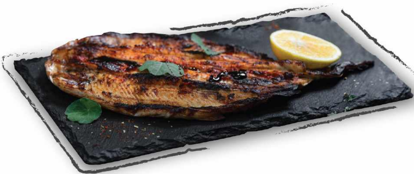
ШАШЛЫК ИЗ ФОРЕЛИ