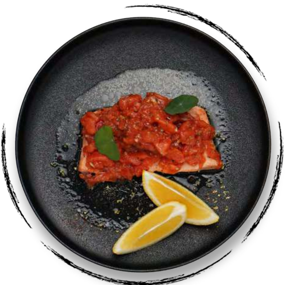
ФИЛЕ ФОРЕЛИ В ФОЛЬГЕ