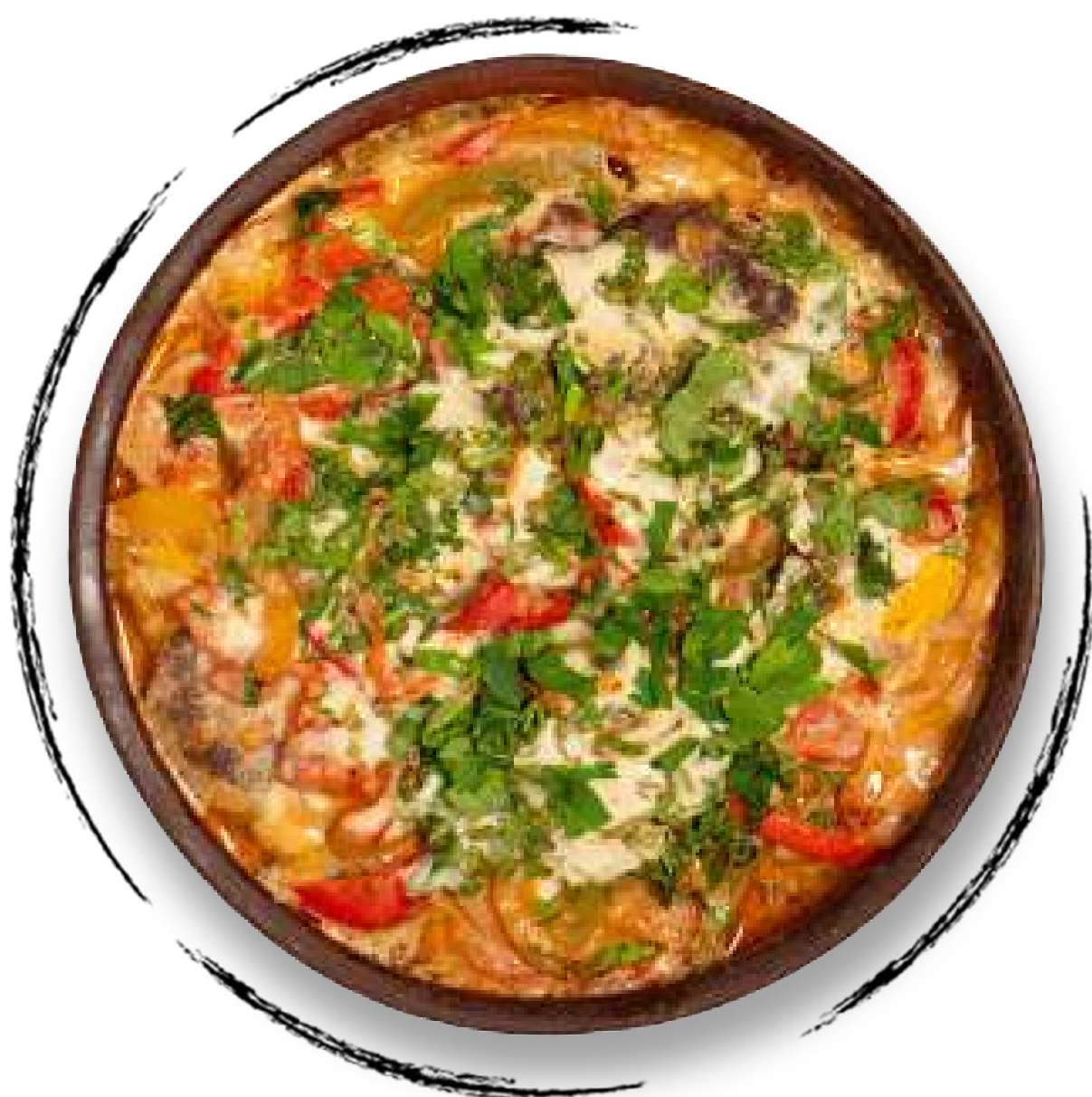
ТЕЛЯТИНА С ОВОЩАМИ И РЕЖАНОМ