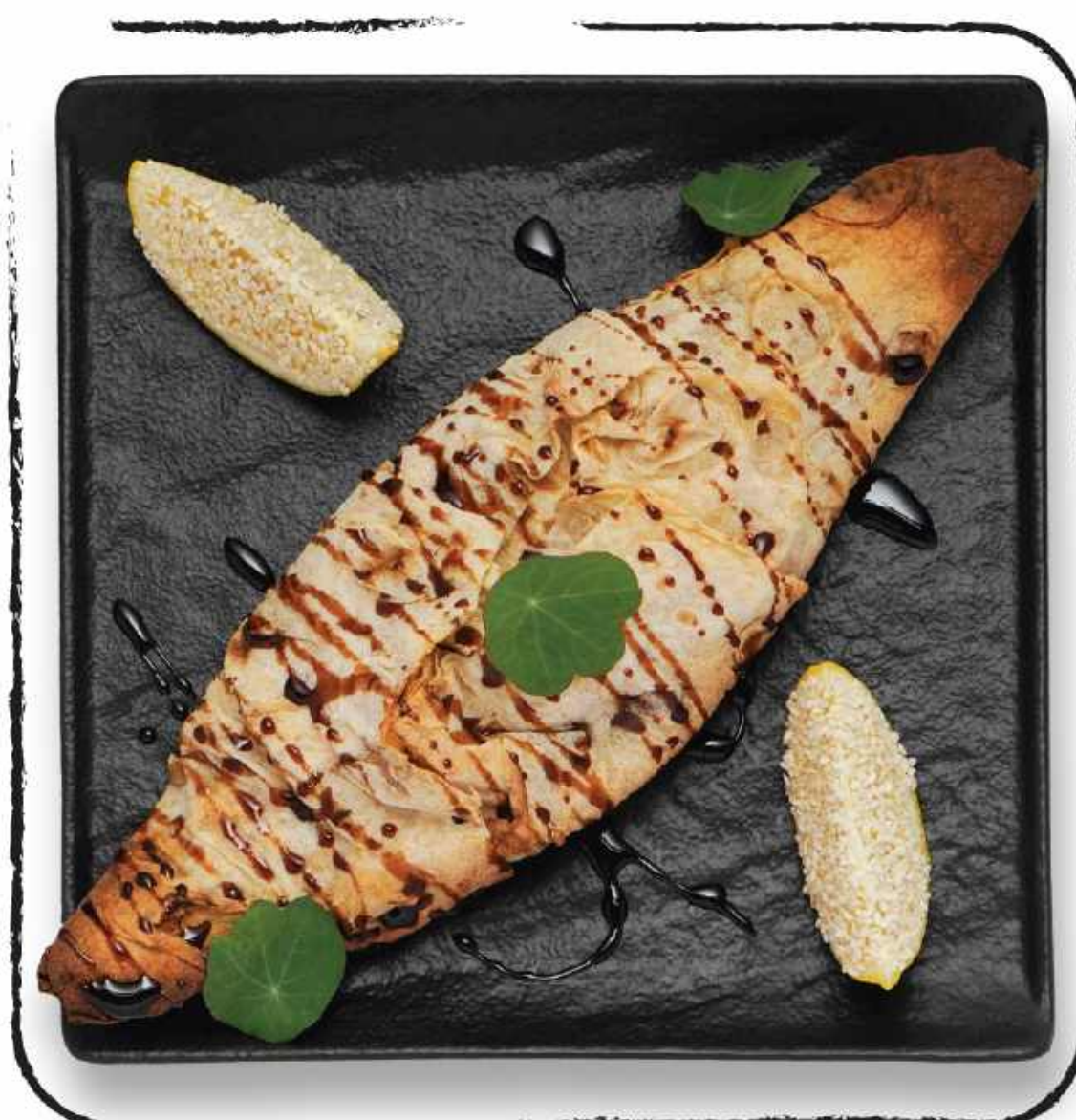
ФИЛЕ ФОРЕЛИ В ЛАВАШЕ