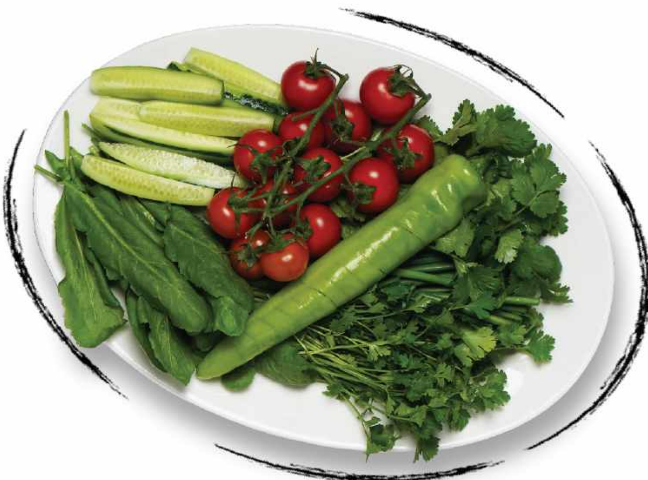
● ЛЕТНИЙ БУКЕТ