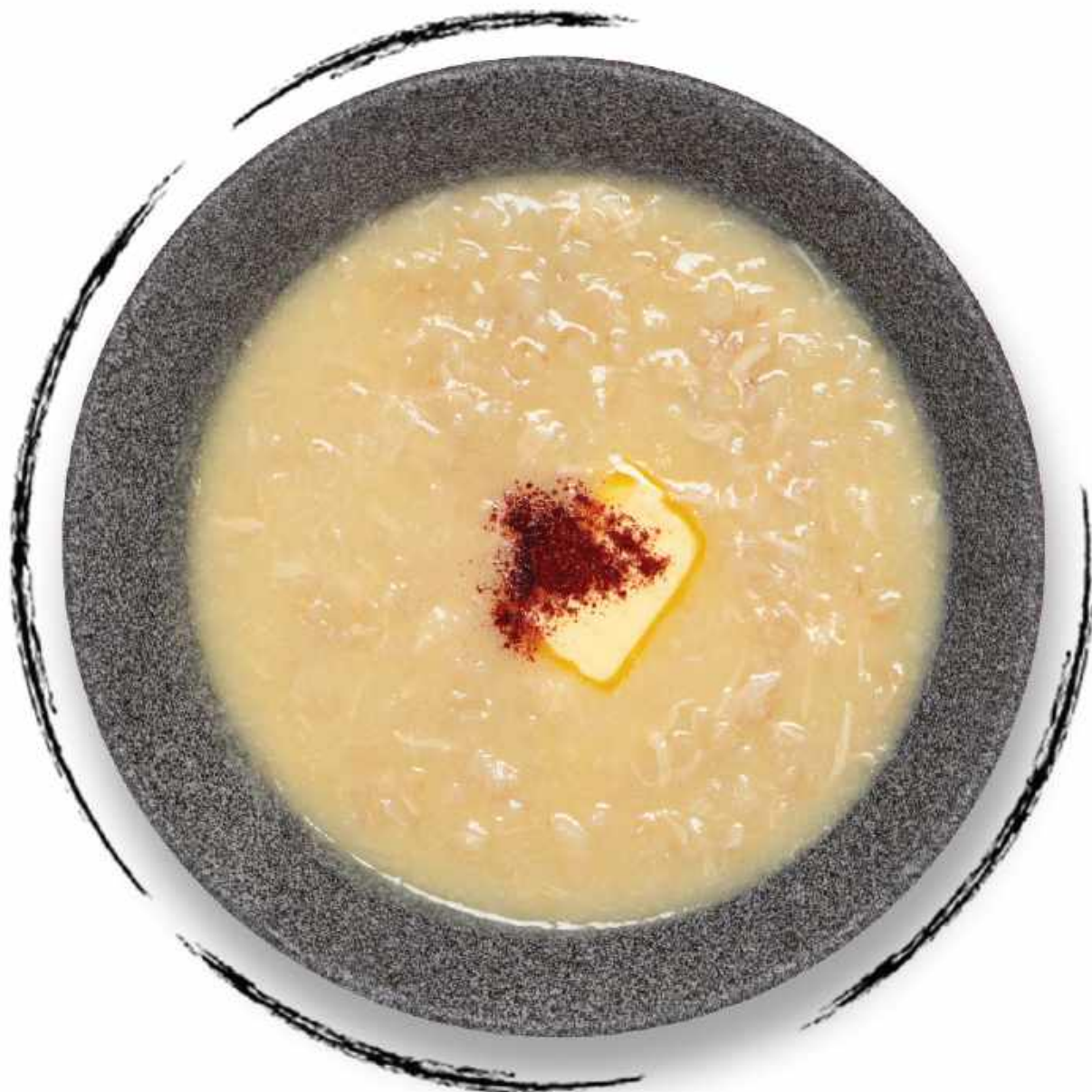
ХАРИСА AMD 2500