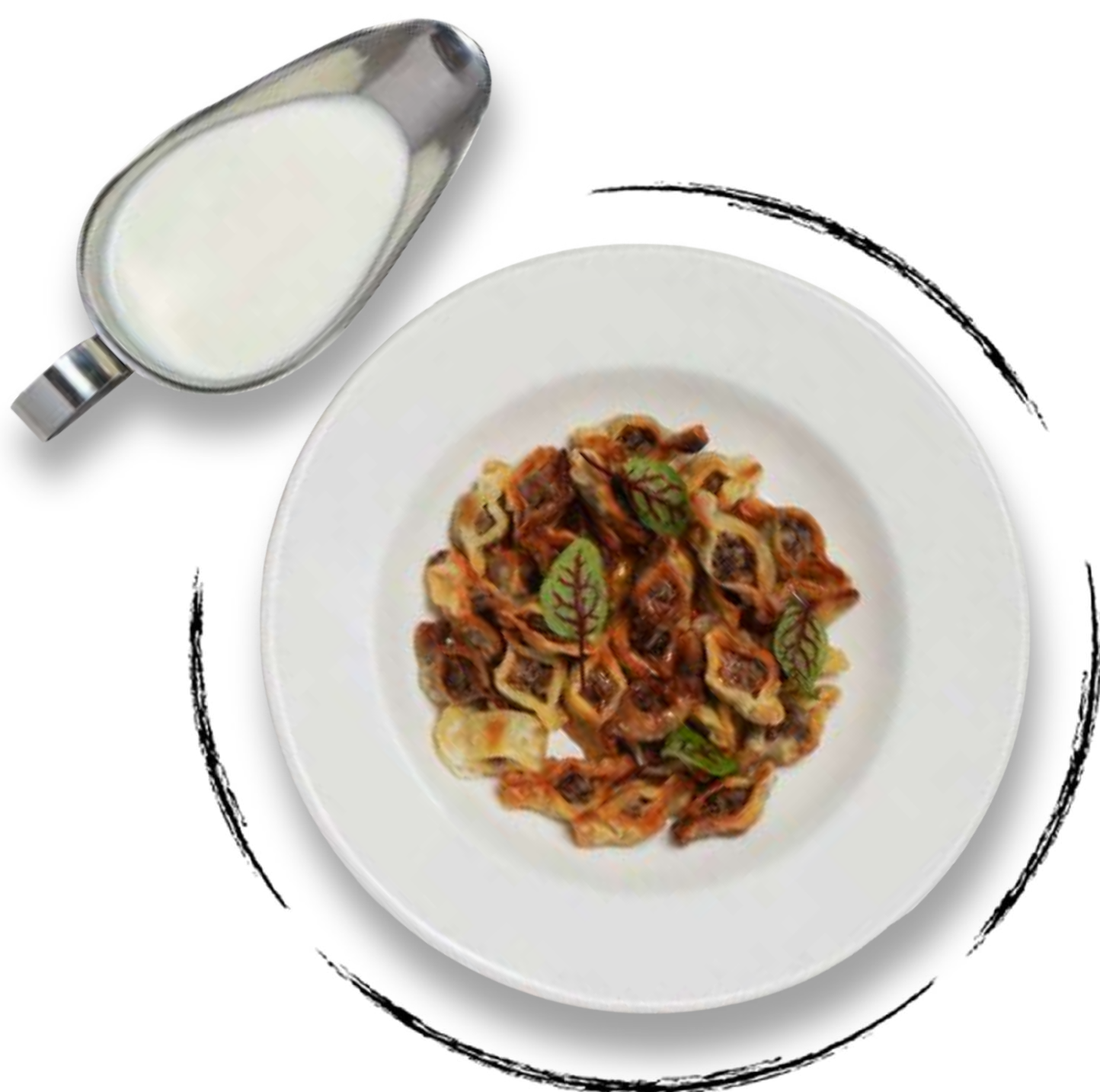
МАНТЫ AMD 3700