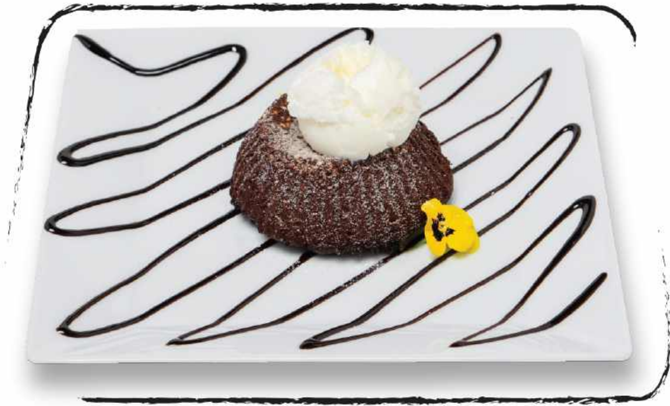
ГОРЯЧИЙ ШОКОЛАДНЫЙ ТОРТ С ТАХИНИ