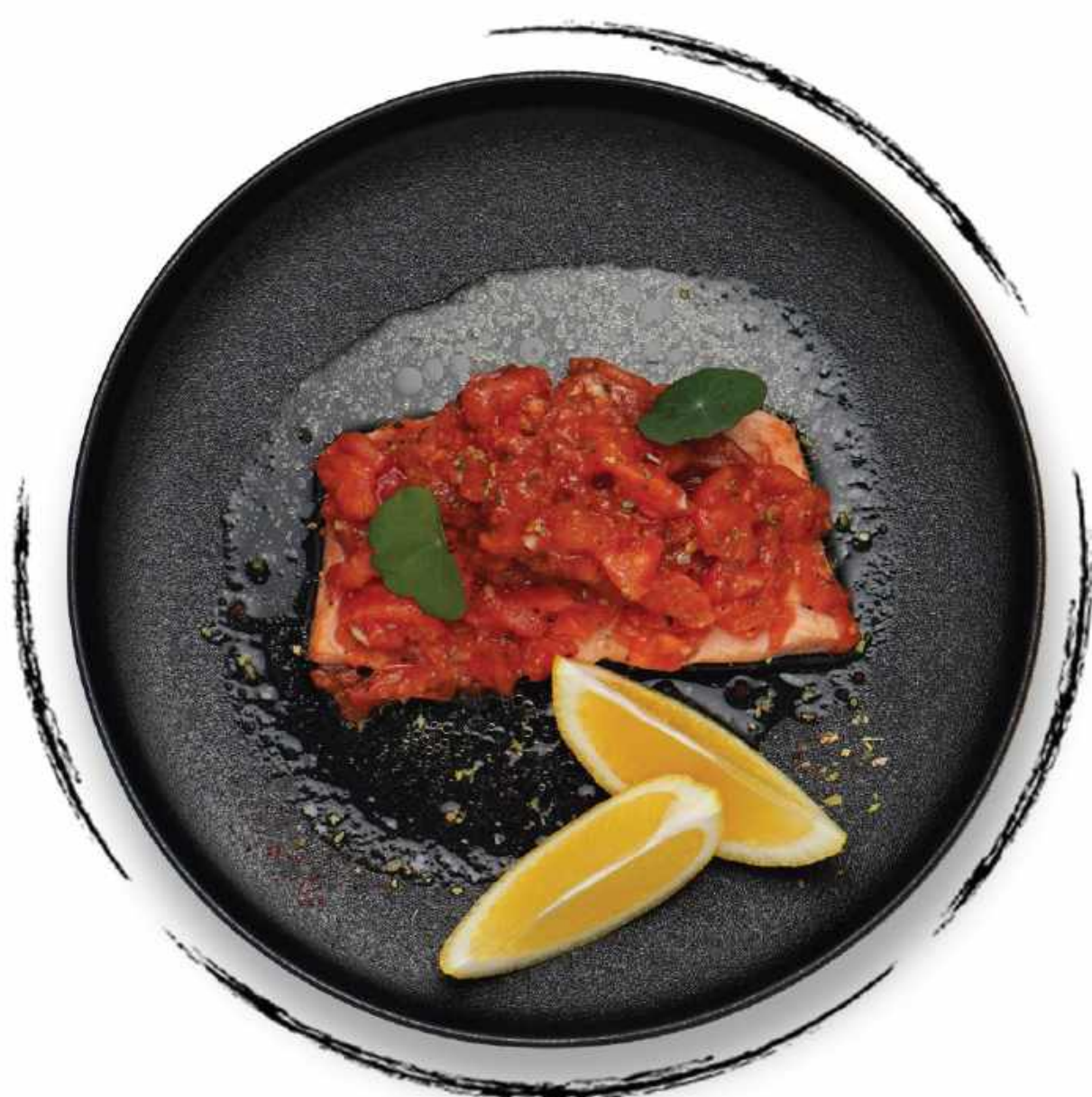
ФИЛЕ ФОРЕЛИ В ФОЛЬГЕ