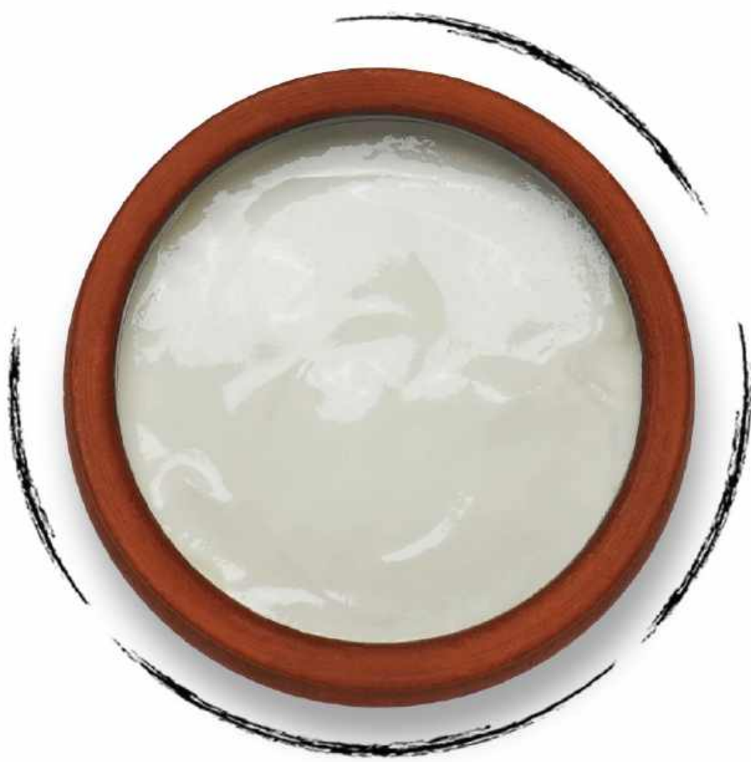
РЕЖАН (ДЕРЕВЕНСКАЯ СМЕТАНА) AMD 2000