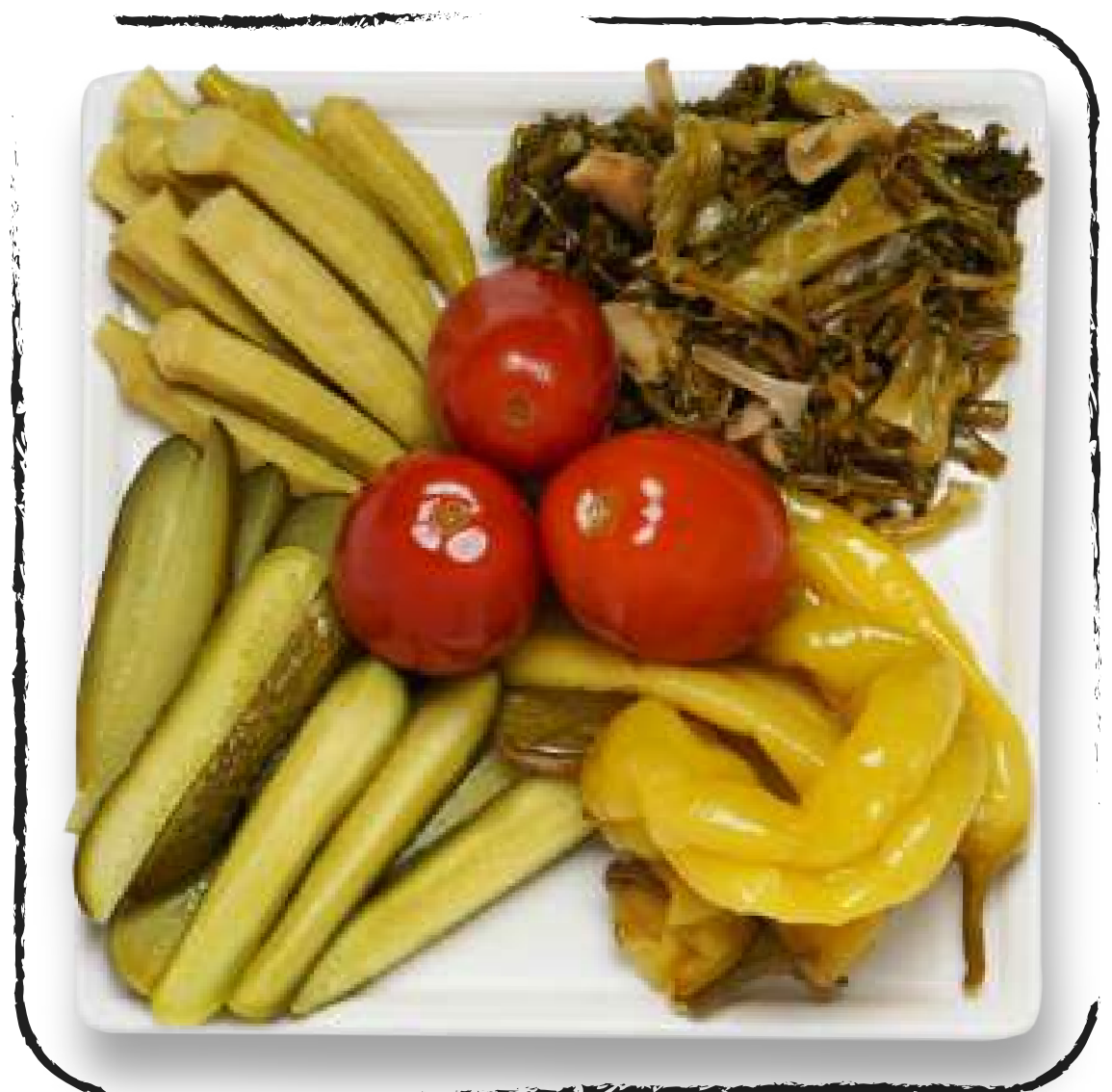
СОЛЕНЬЯ / МАРИНАДЫ AMD 2500