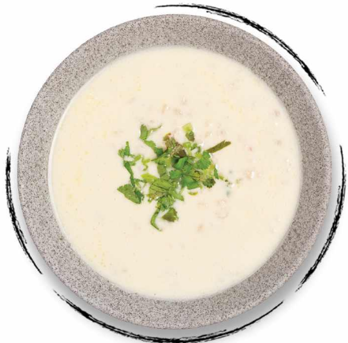
СПАС AMD 1500