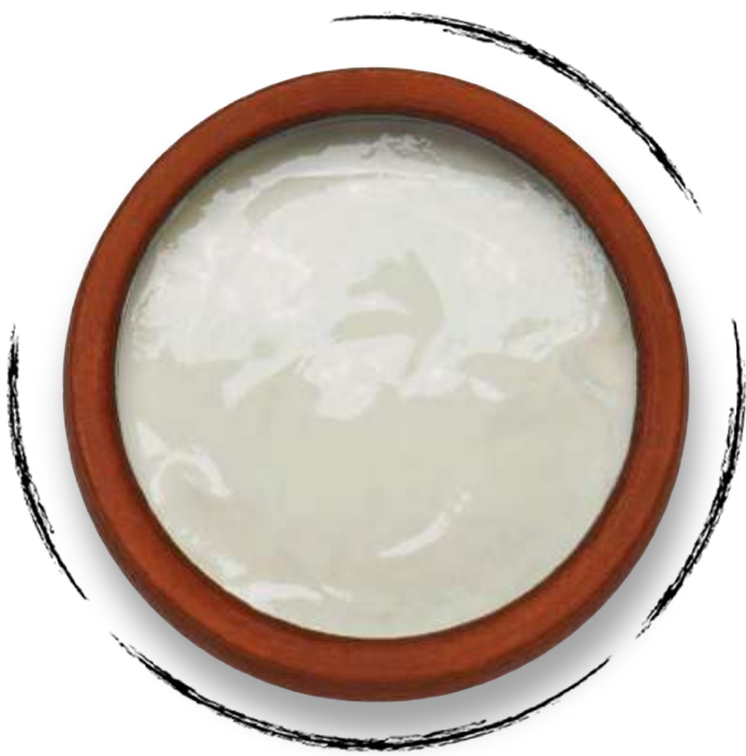
РЕЖАН (ДЕРЕВЕНСКАЯ СМЕТАНА) AMD 2000