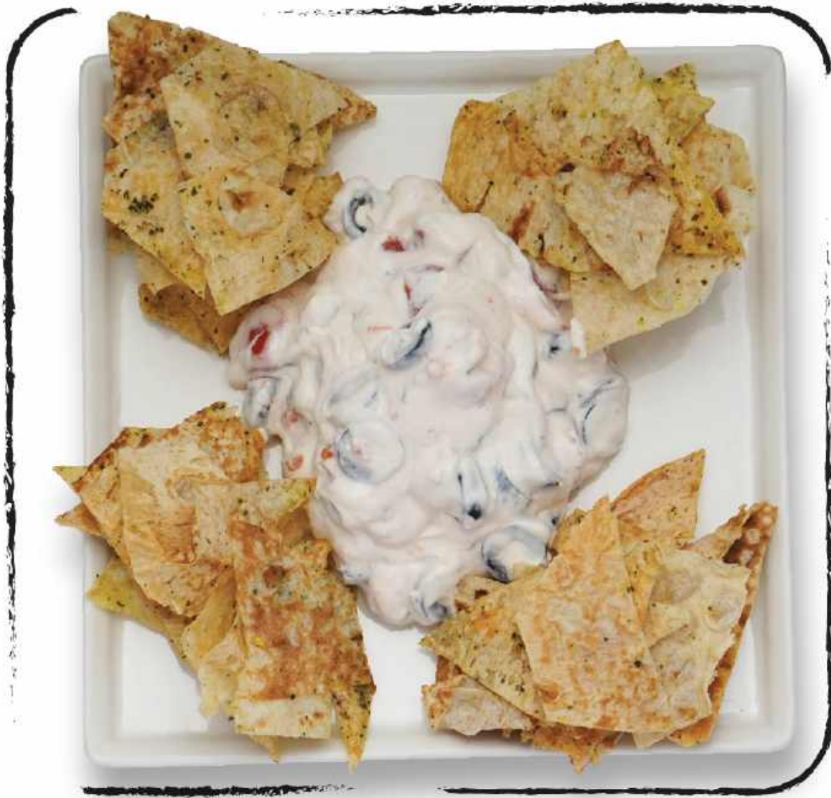
● САЛАТ С МАЦОНИ И ЧИПСАМИ