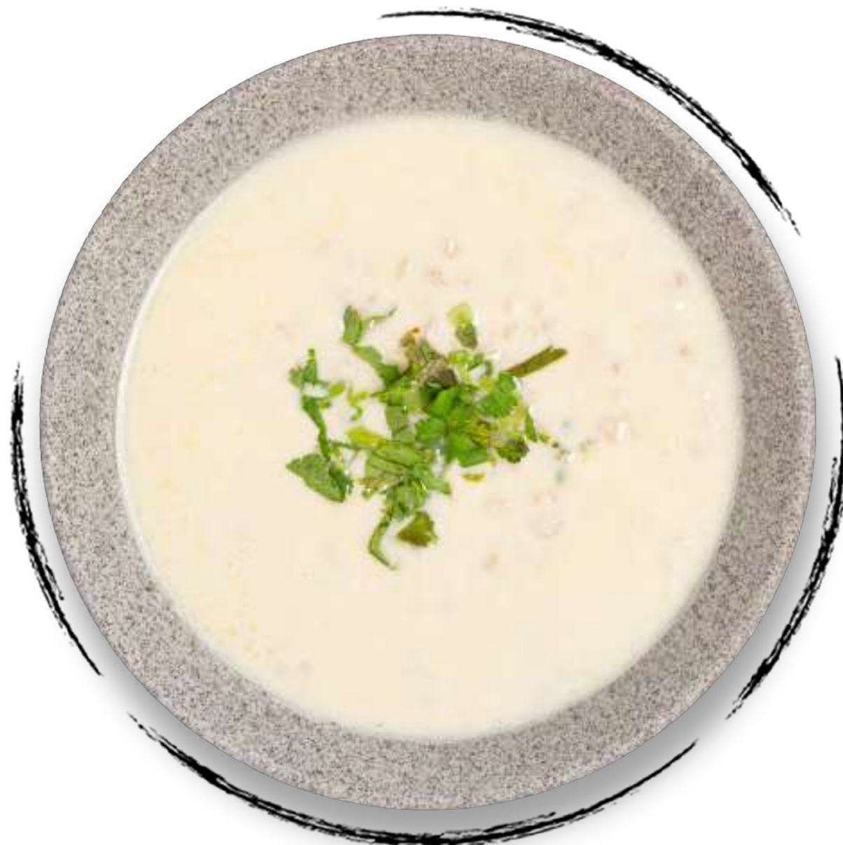
СПАС AMD 1500