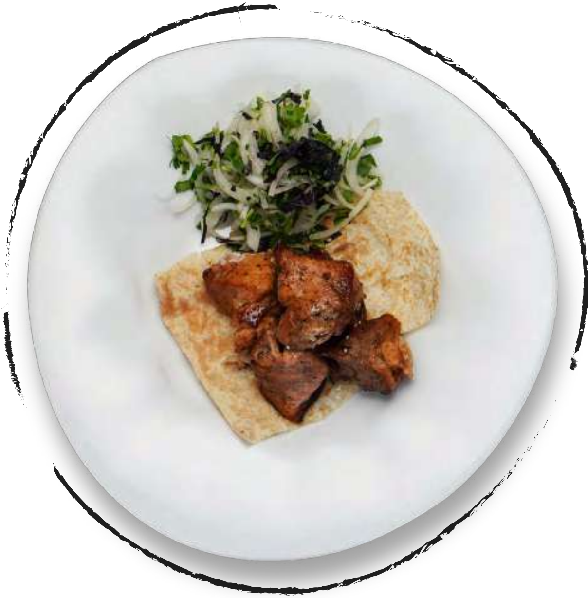
ШАШЛЫК ИЗ СВИНИНЫ