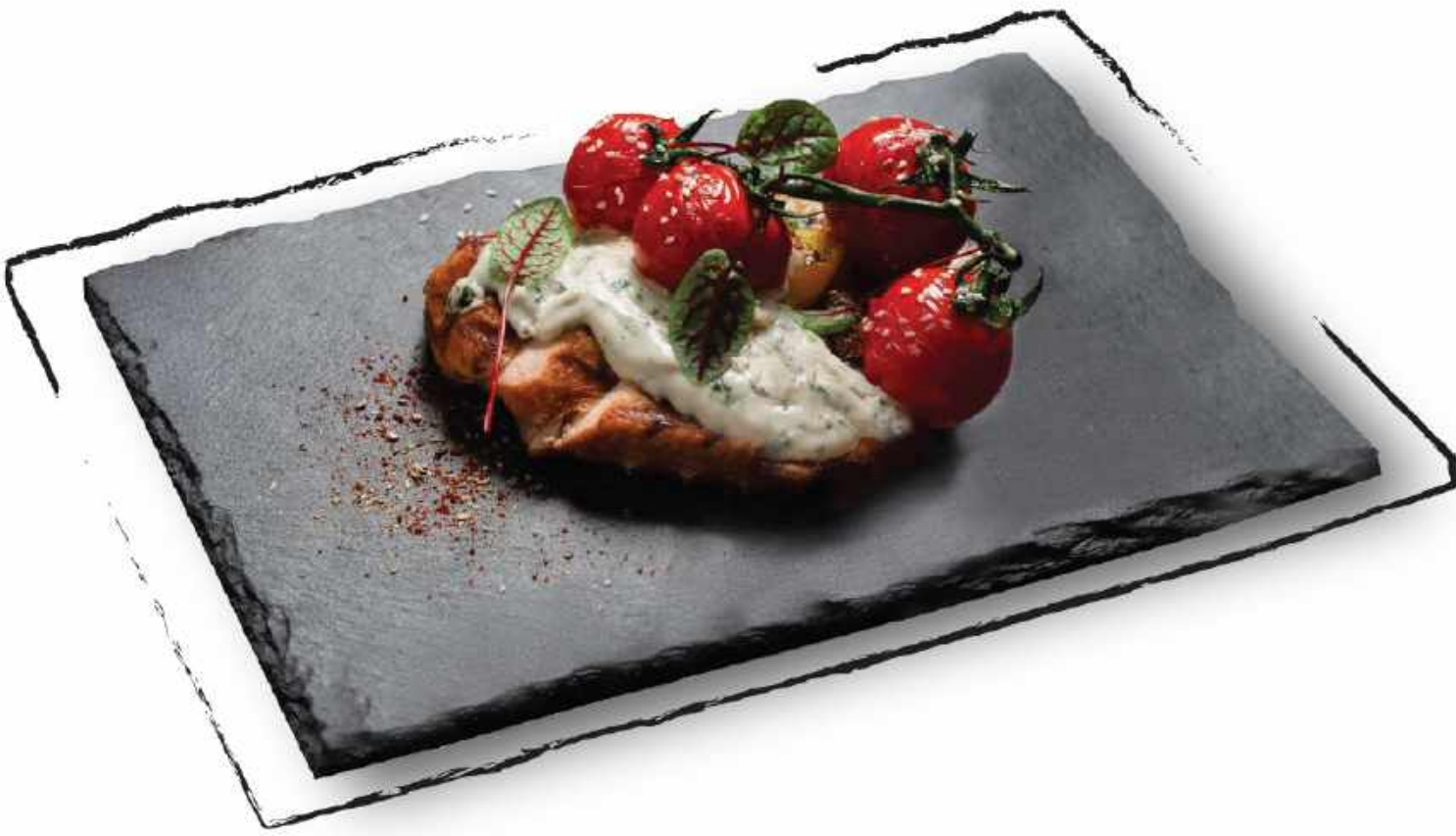
КУРИНАЯ ГРУДКА НА ГРИЛЕ AMD 5000