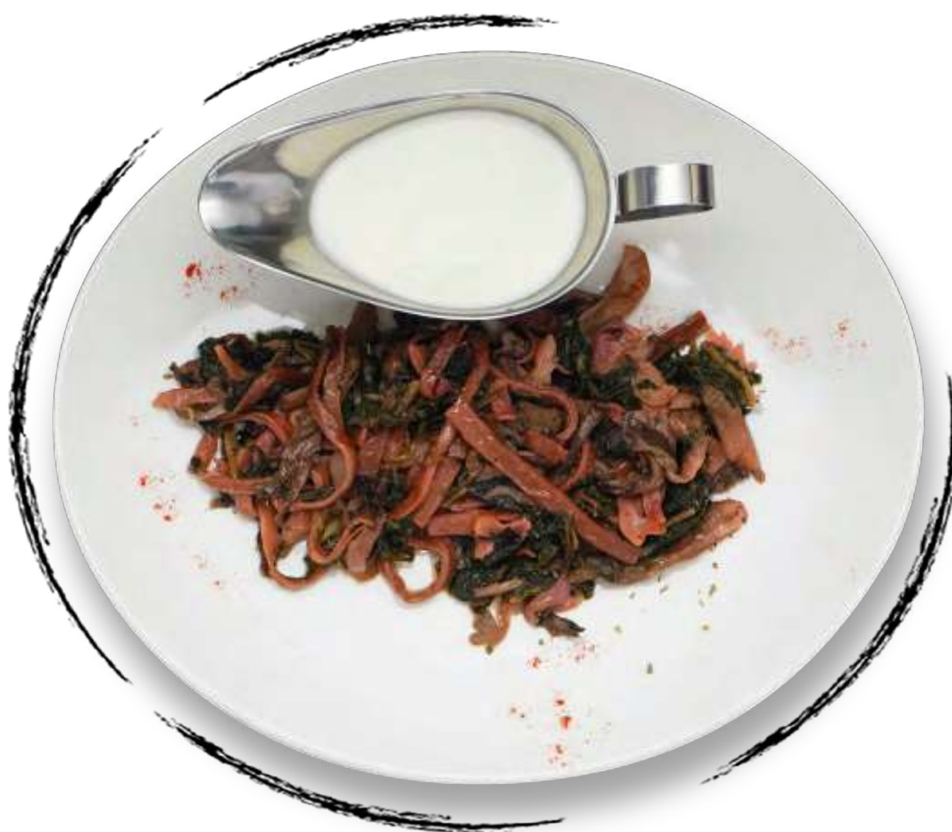
АРИШТА С ● ДРЕВЕСНЫМИ ГРИБАМИ AMD 2400