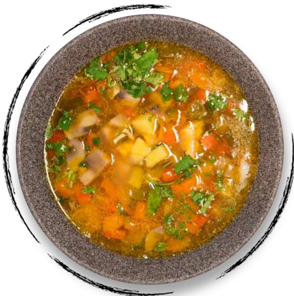
● СУП ИЗ КРАСНОЙ ФАСОЛИ С ГРЕЦКИМИ ОРЕХАМИ