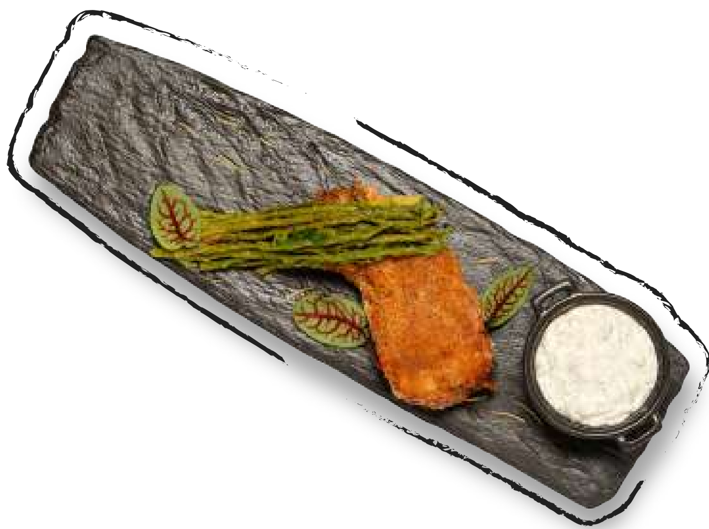
СВИНИНА СО СПАРЖЕЙ