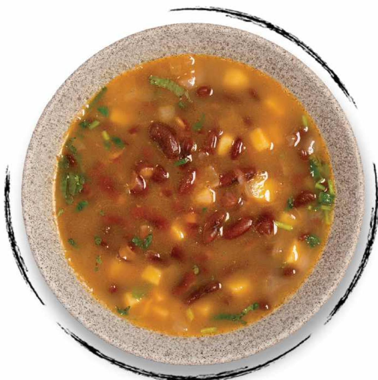
● СУП ИЗ КРАСНОЙ ФАСОЛИ С ГРЕЦКИМИ ОРЕХАМИ AMD 1700