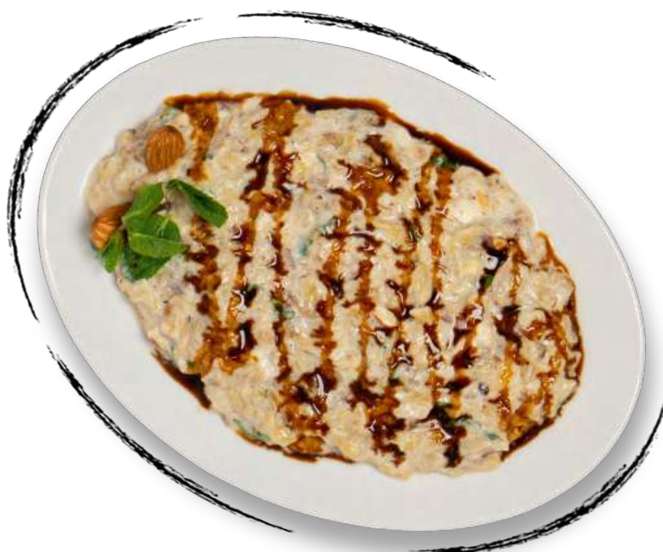
● РУЛЕТКИ ИЗ ЖАРЕННЫХ БАКЛАЖАНОВ С ГРЕЦКИМИ ОРЕХАМИ AMD 2500