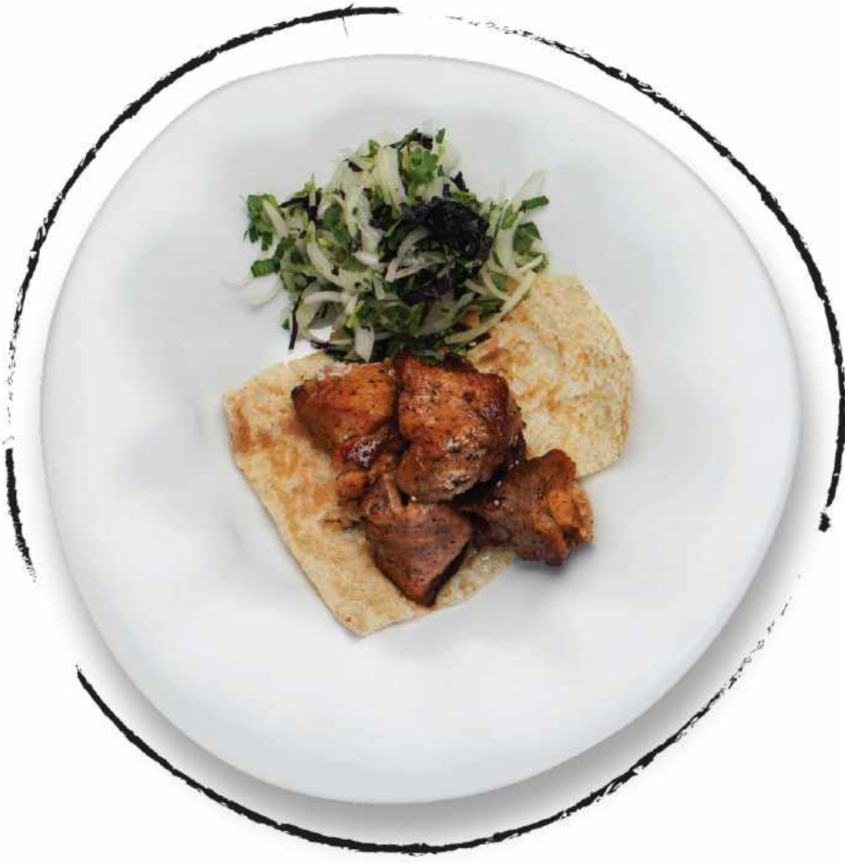
ШАШЛЫК ИЗ СВИНИНЫ