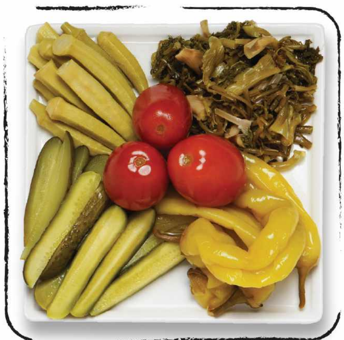
СОЛЕНЬЯ / МАРИНАДЫ AMD 2500