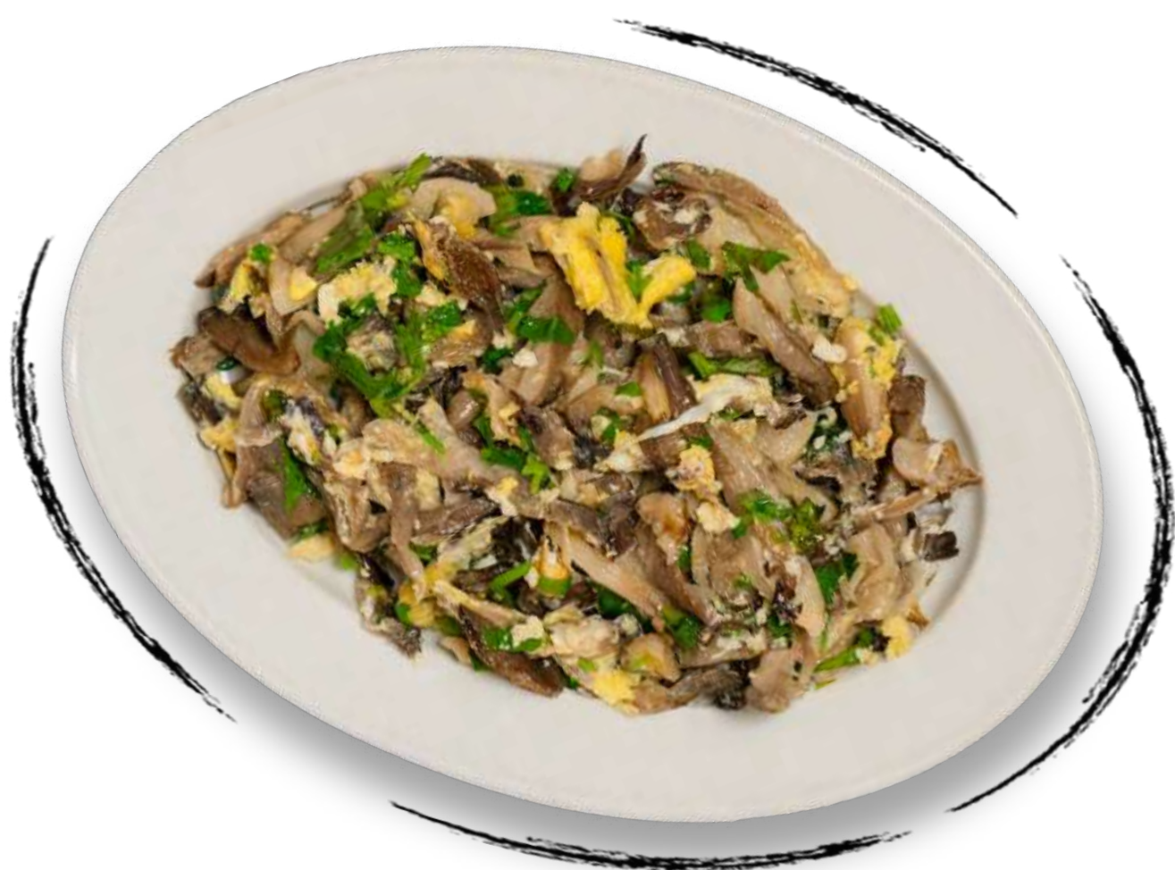
ЖАРЕННЫЕ ДРЕВЕСНЫЕ ГРИБЫ AMD 2500 / 1500