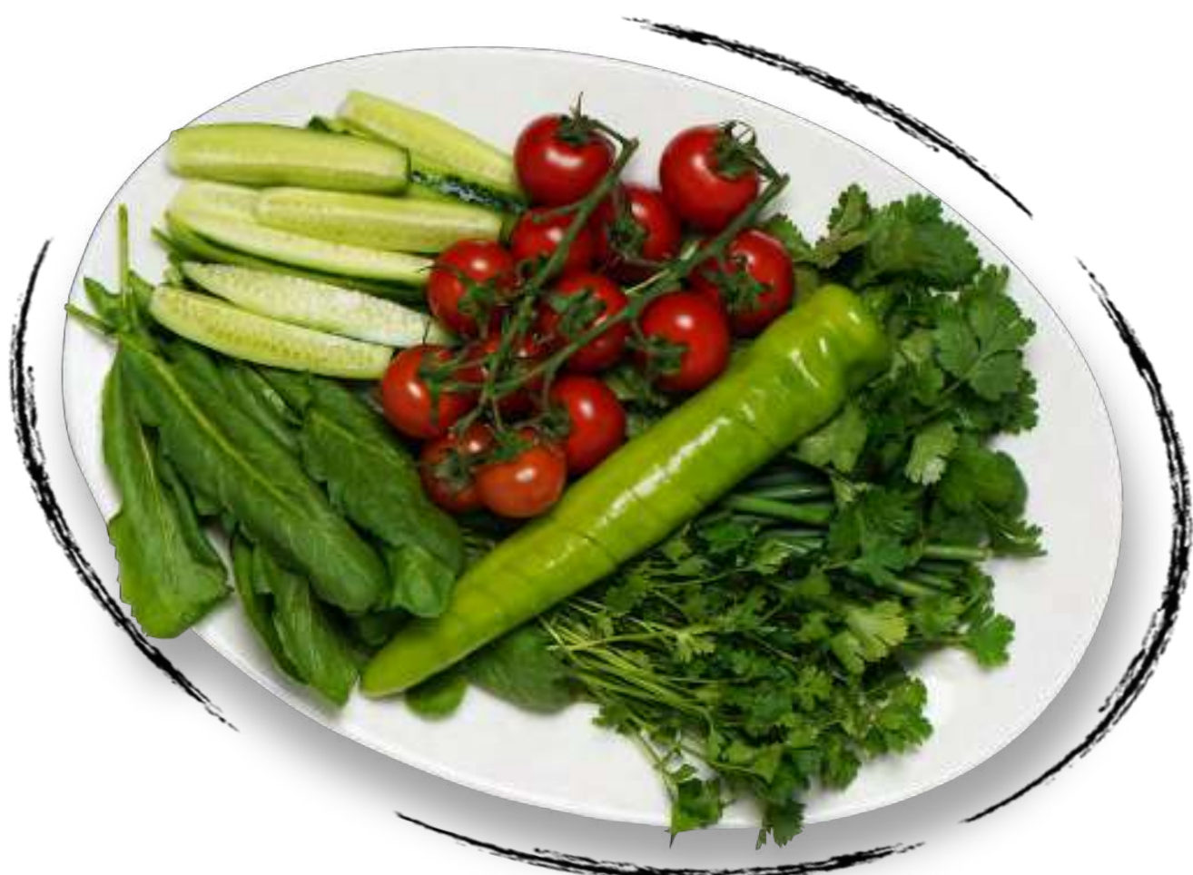
● ЛЕТНИЙ БУКЕТ