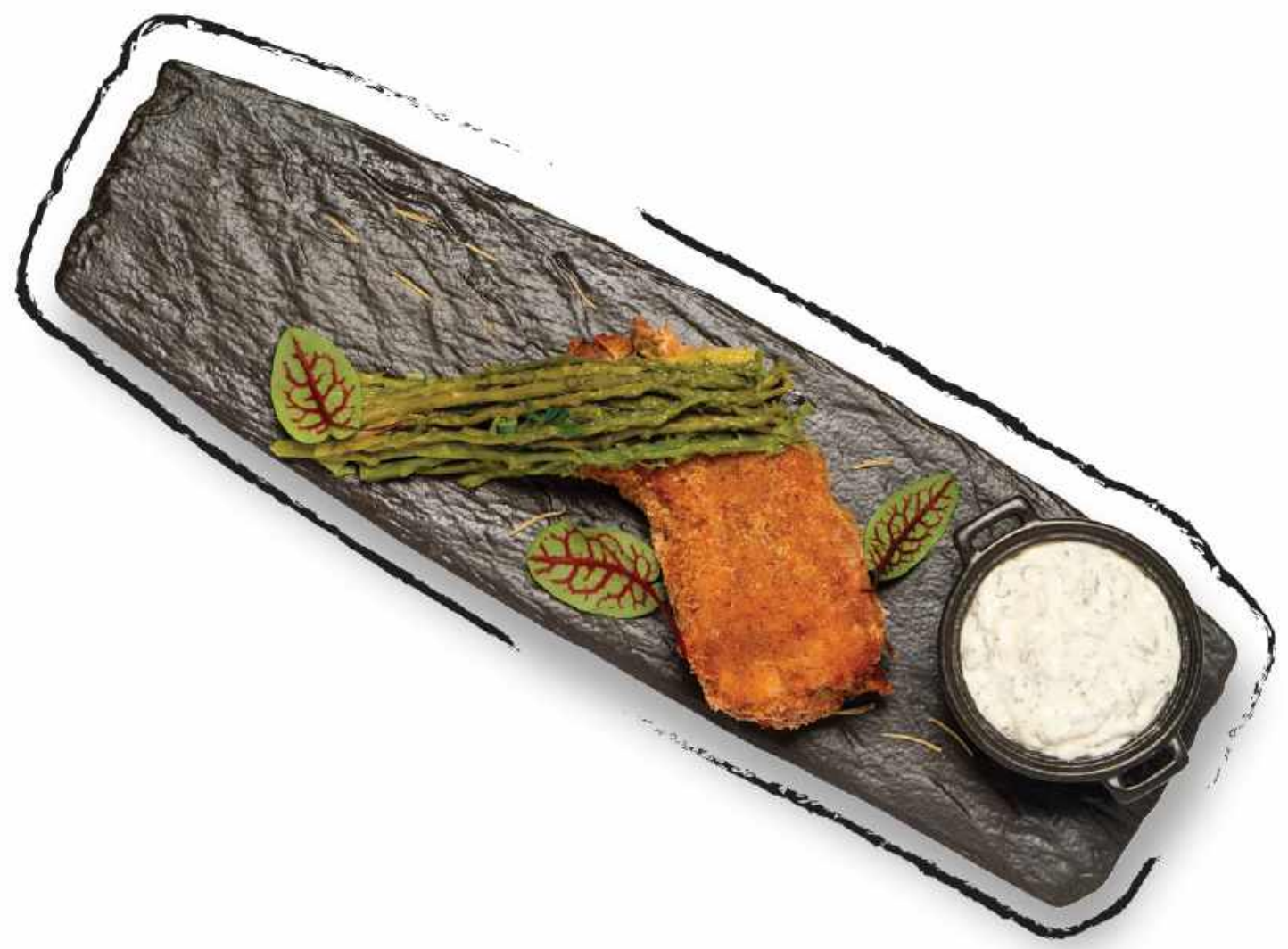
СВИНИНА СО СПАРЖЕЙ