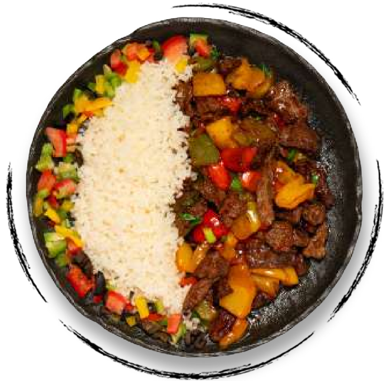
ТЕЛЯТИНА ПО РЕЦЕПТУ ШЕФ-ПОВАРА AMD 4500