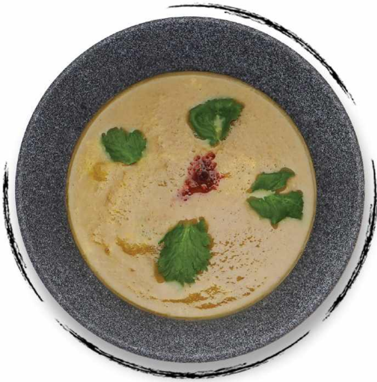
ГРИБНОЙ СУП-ПЮРЕ AMD 2200