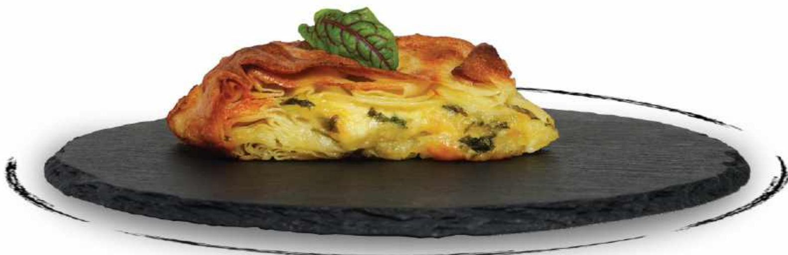
ТЕПЛЫЙ СУБОРЕГ ● AMD 3500