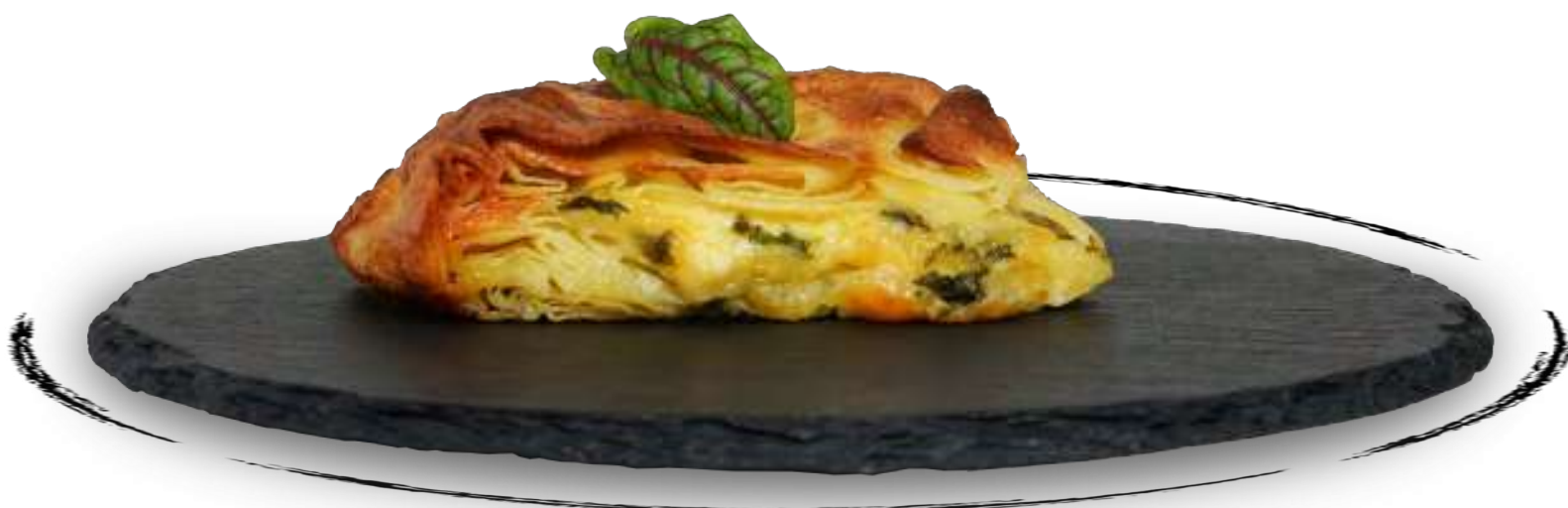
ТЕПЛЫЙ СУБОРЕГ ● AMD 3500