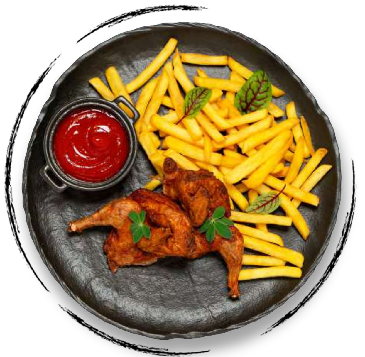
ЖАРЕННЫЙ ЦЫПЛЕНОК AMD 3200