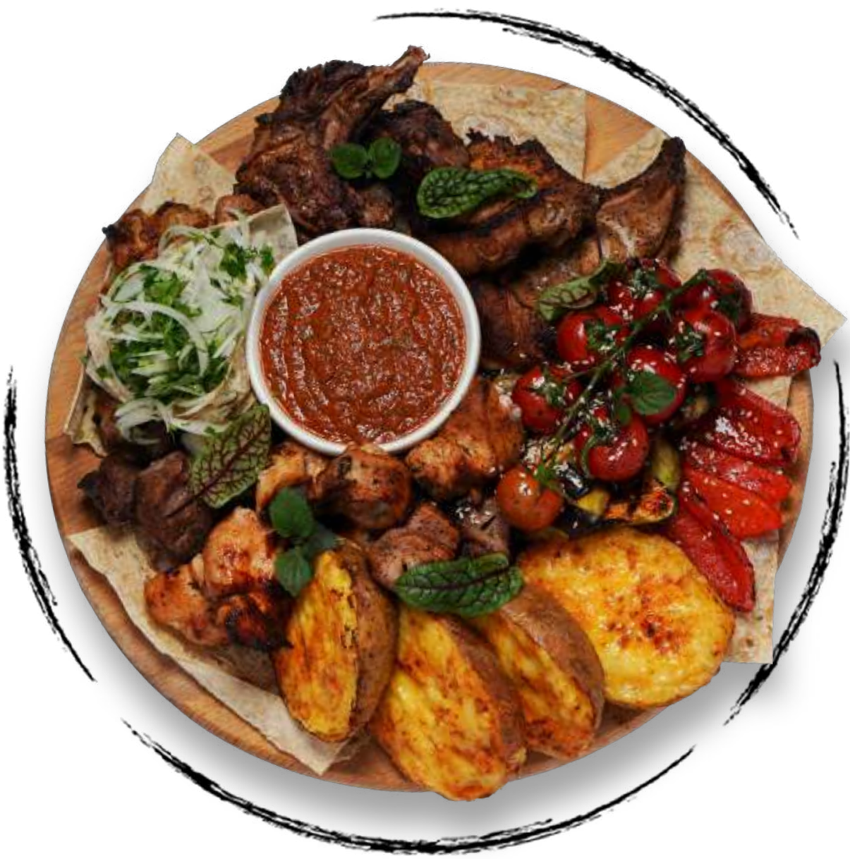
АССОРТИ ШАШЛЫКА (НА 6 ПЕРСОН)