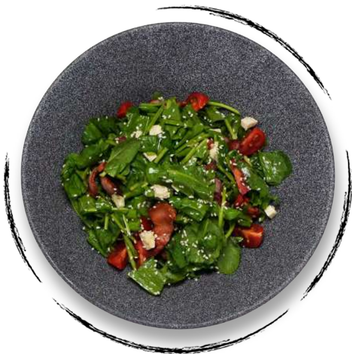
КРЕСС-САЛАТ С СЫРОМ РОКФОР AMD 3000