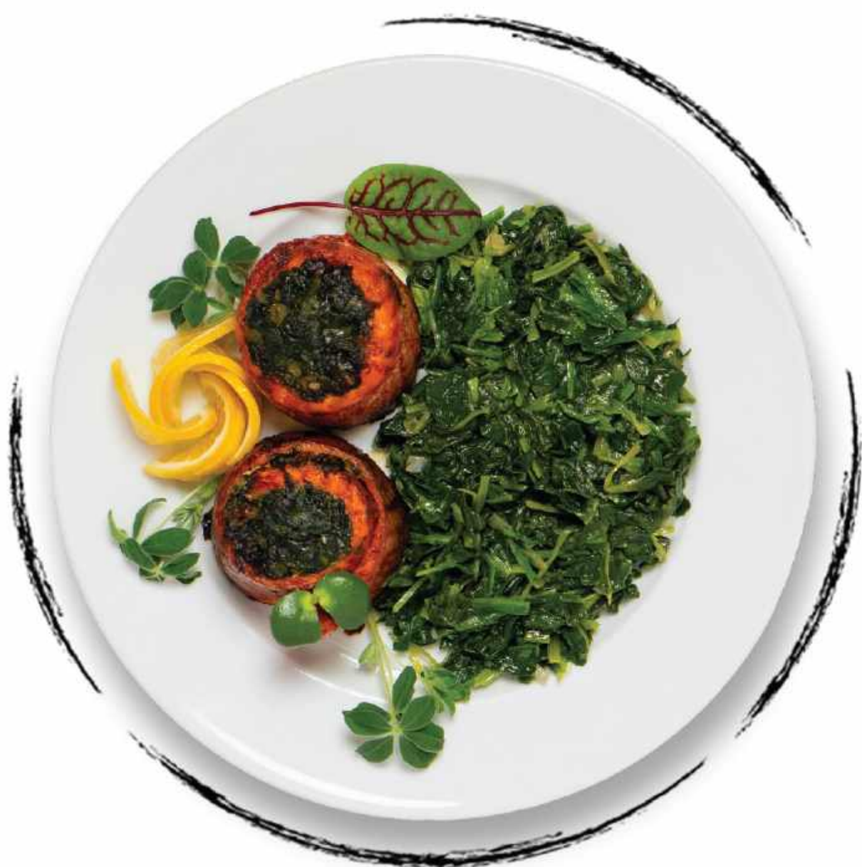
ФИЛЕ ФОРЕЛИ СО ШПИНАТОМ