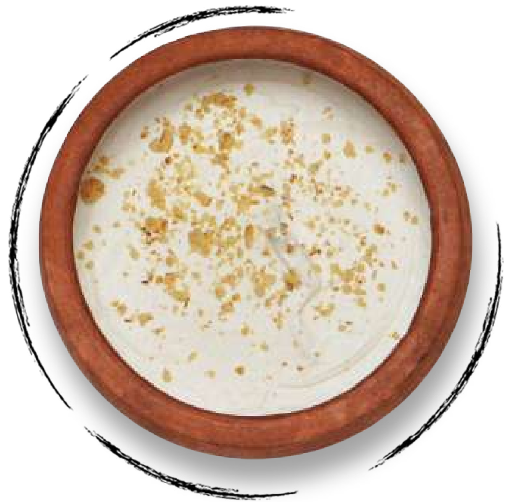
СЦЕЖЕННЫЙ МАЦОНИ (ЙОГУРТ) AMD 1700