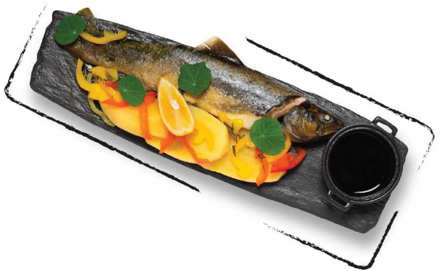
РЕЧНАЯ ФОРЕЛЬ AMD 10000