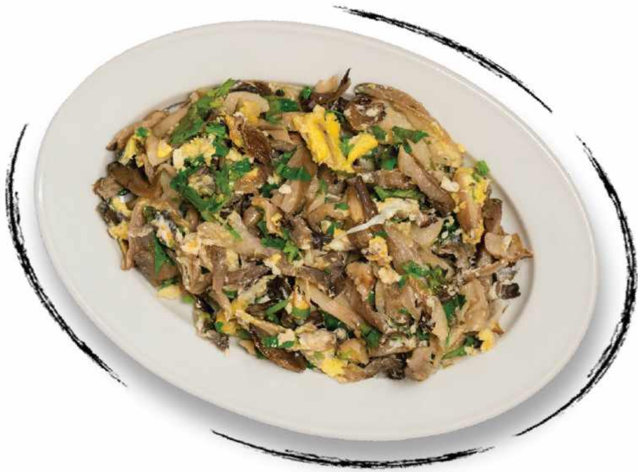
ЖАРЕННЫЕ ДРЕВЕСНЫЕ ГРИБЫ AMD 2500 / 1500