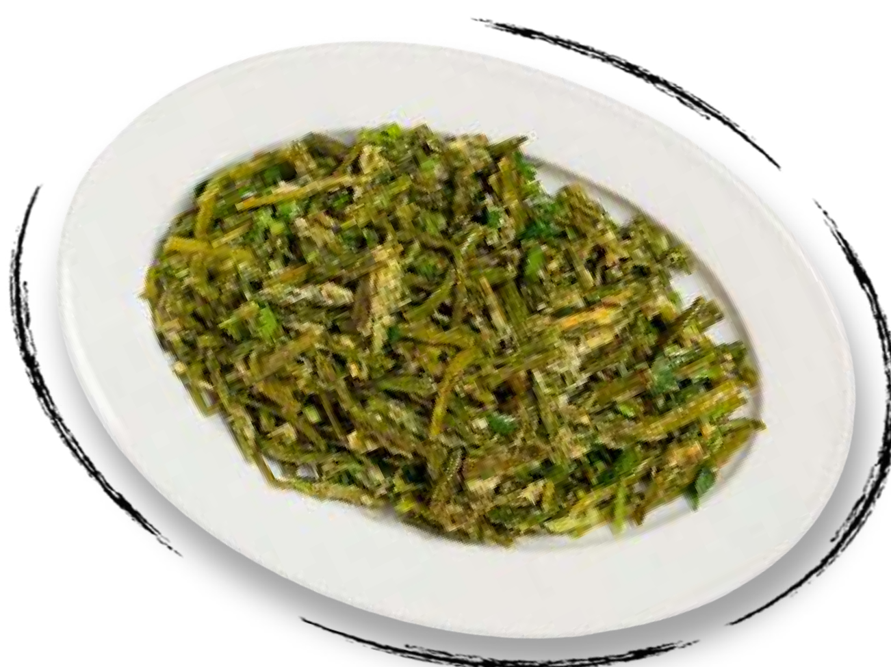
ЖАРЕНАЯ СПАРЖА AMD 4000 / 2500