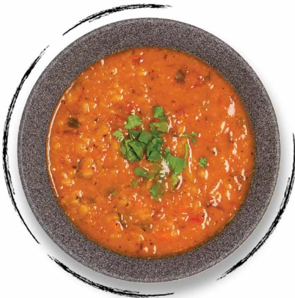
● СУП ИЗ ЧЕЧЕВИЦЫ И ОВОЩЕЙ AMD 1700