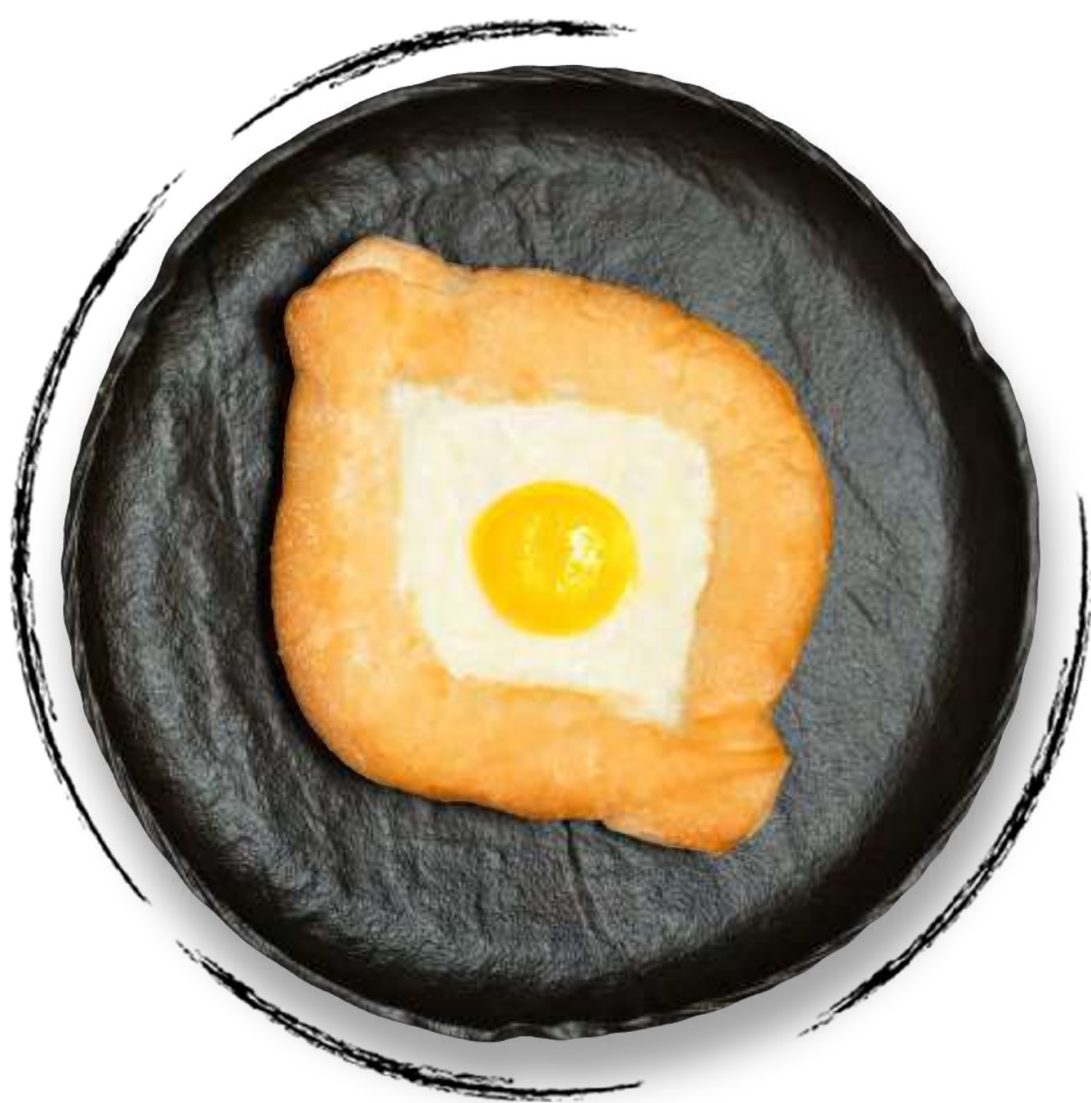
ХАЧАПУРИ ПО-АДЖАРСКИ AMD 2000