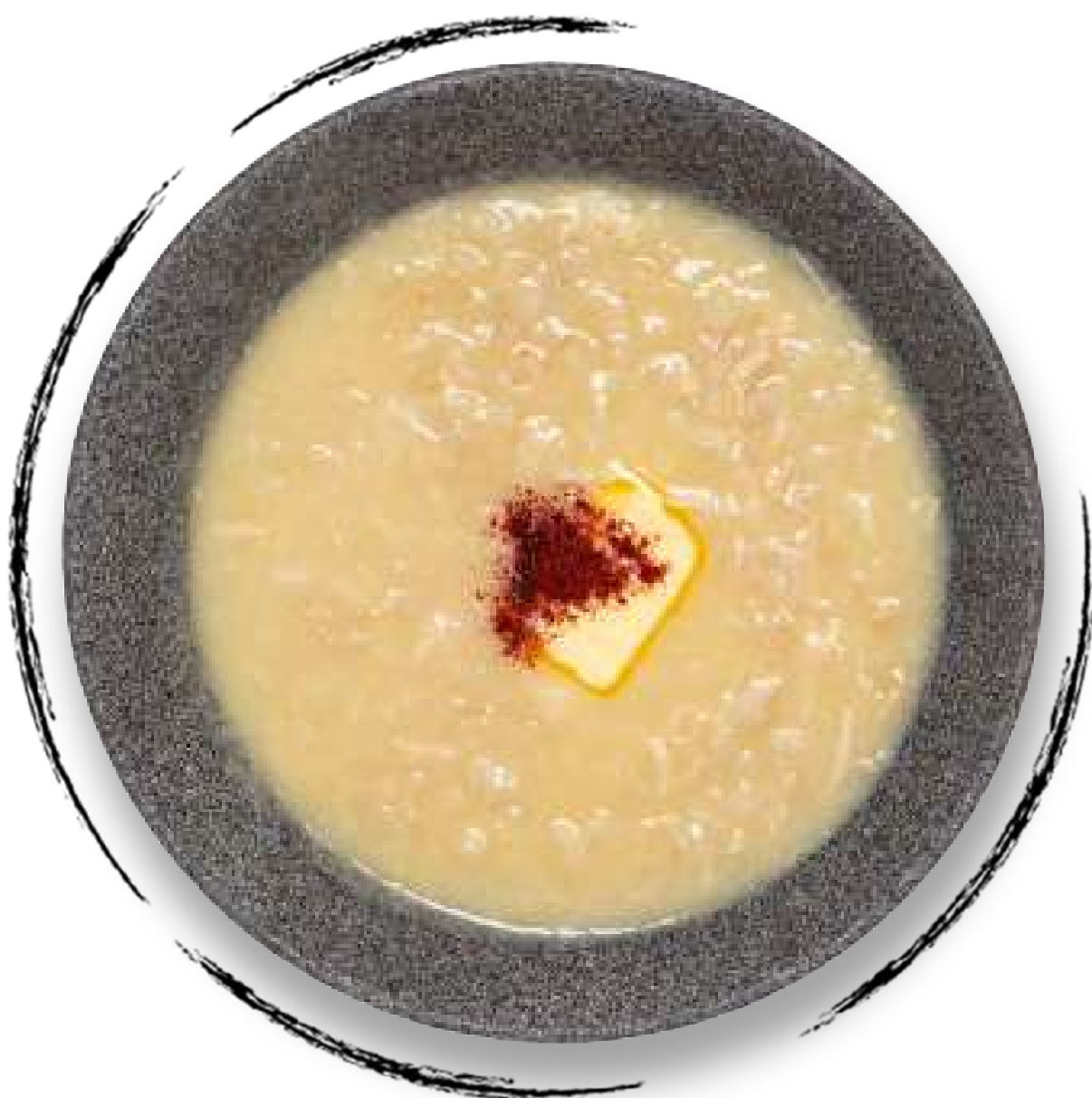
ХАРИСА AMD 2500