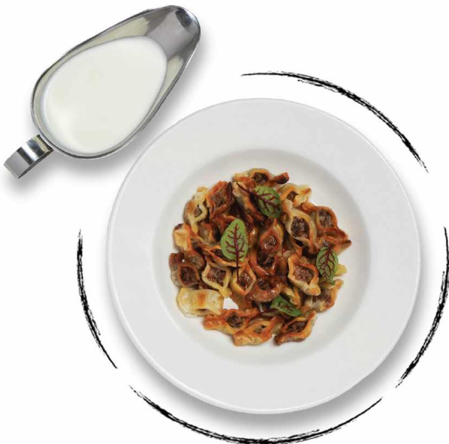
МАНТЫ AMD 3700