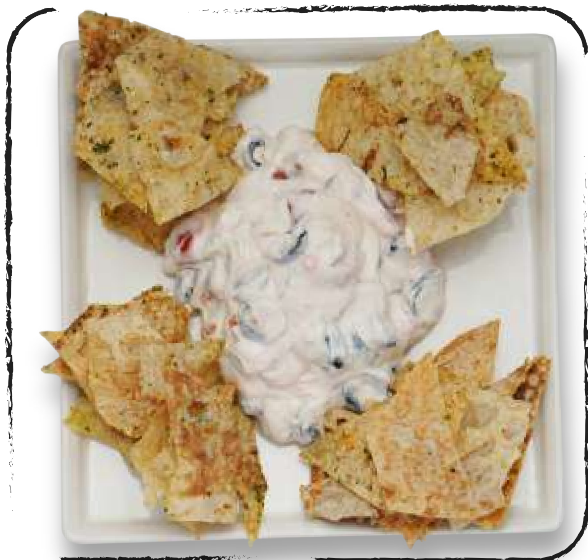
● САЛАТ С МАЦОНИ И ЧИПСАМИ