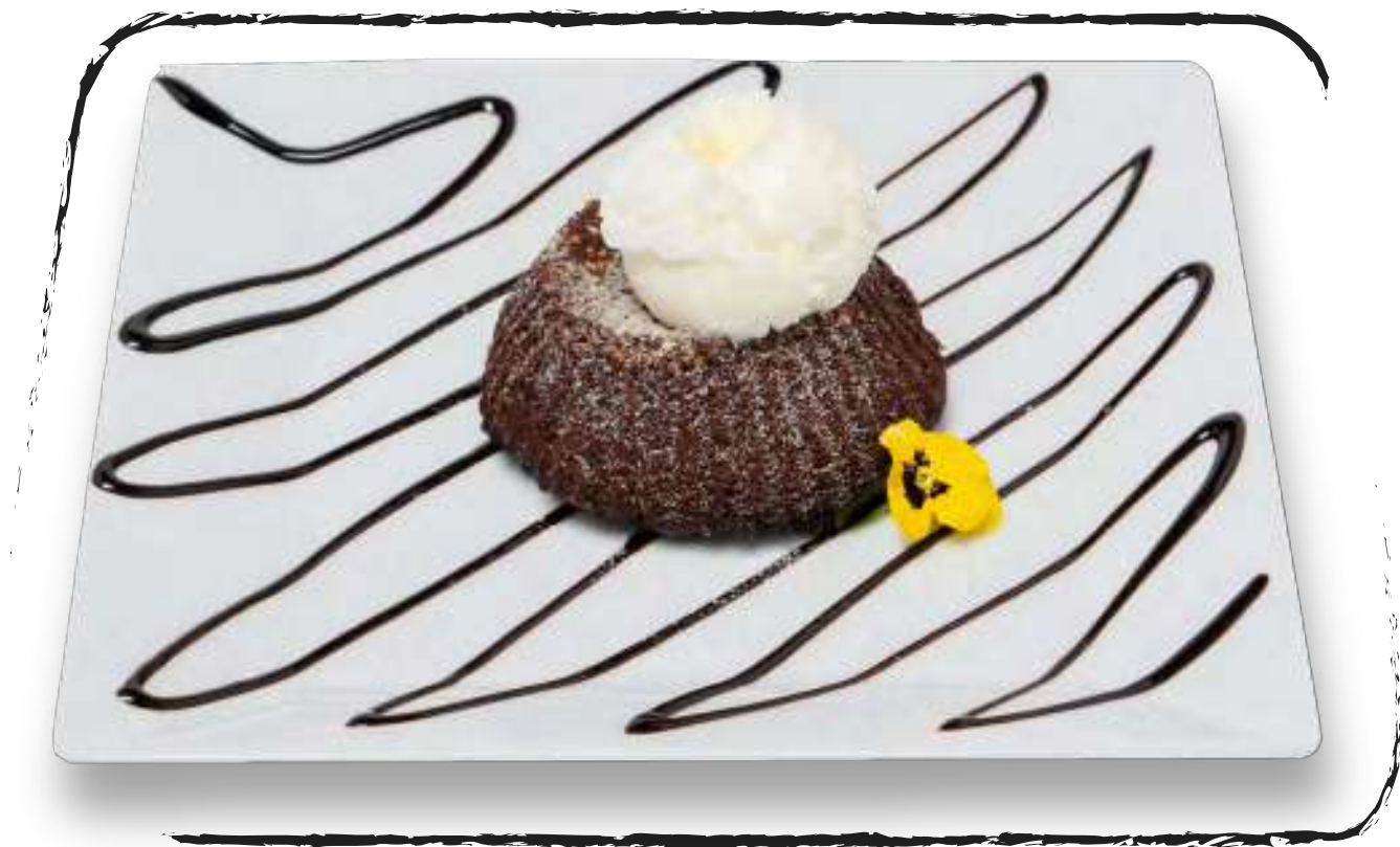
ГОРЯЧИЙ ШОКОЛАДНЫЙ ТОРТ С ТАХИНИ