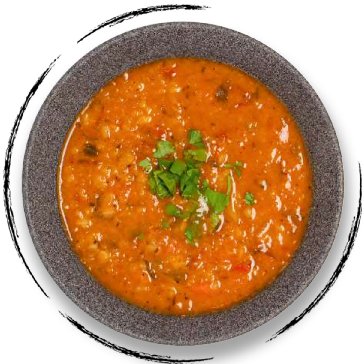
● СУП ИЗ ЧЕЧЕВИЦЫ И ОВОЩЕЙ AMD 1700