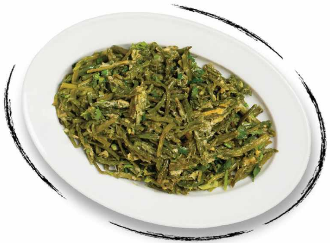
ЖАРЕНАЯ СПАРЖА AMD 4000 / 2500