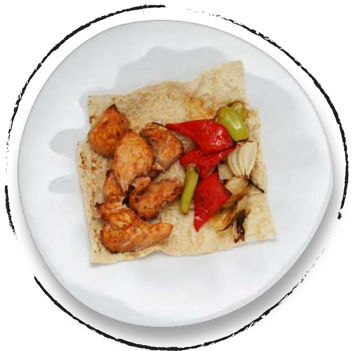
ШАШЛЫК ИЗ КУРИЦЫ