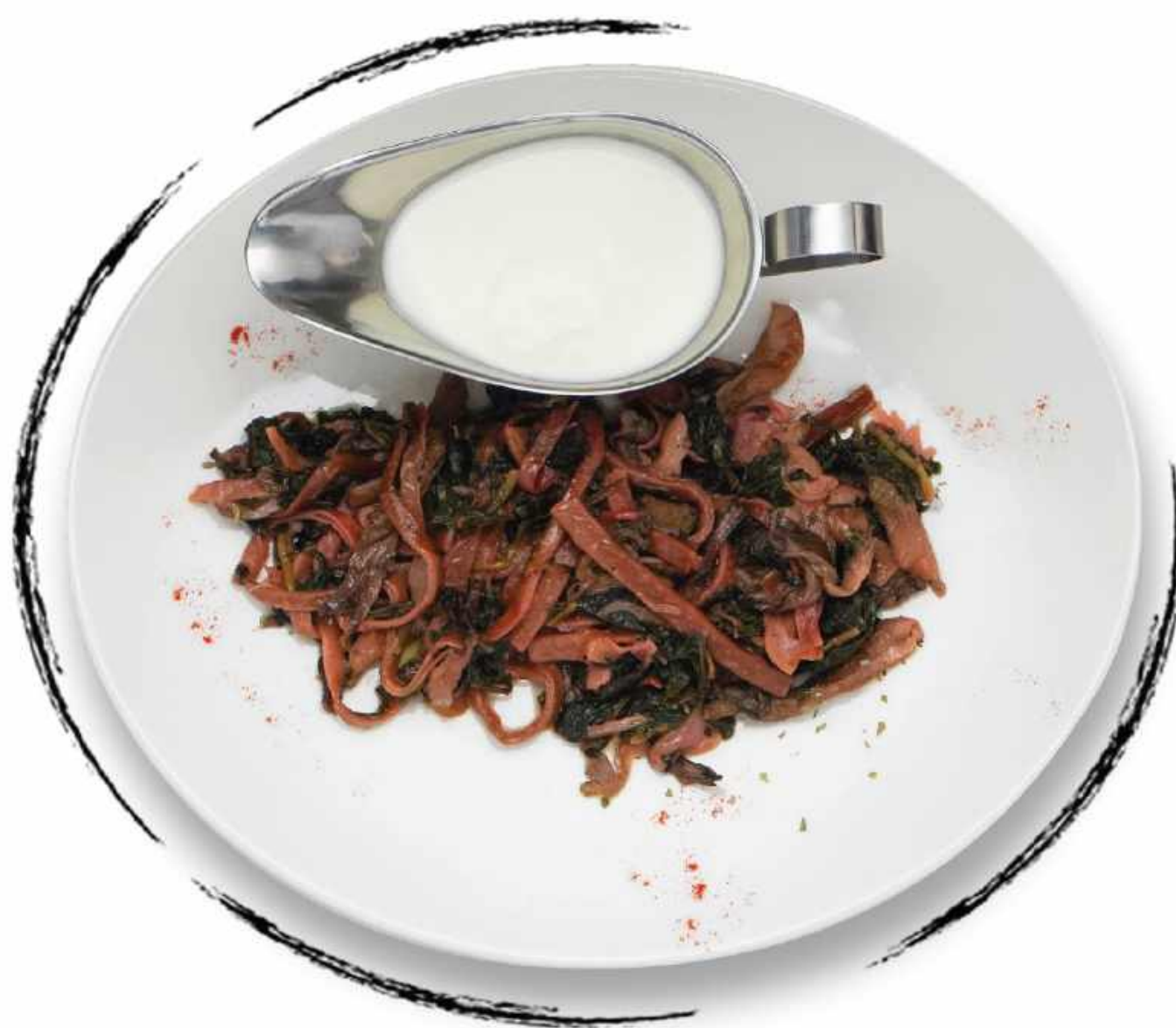
АРИШТА С ● ДРЕВЕСНЫМИ ГРИБАМИ AMD 2400