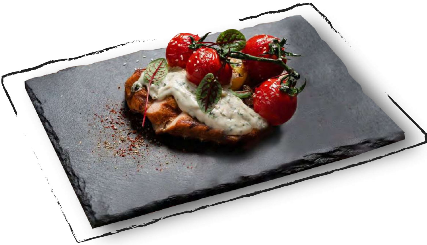
КУРИНАЯ ГРУДКА НА ГРИЛЕ AMD 5000