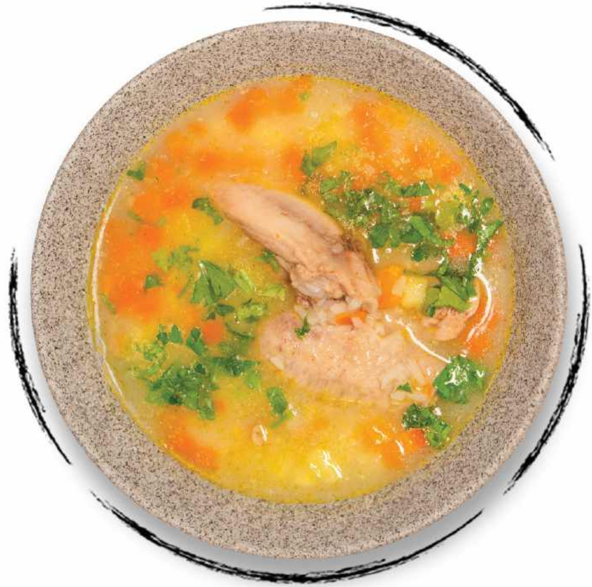
КУРИНЫЙ СУП AMD 2000