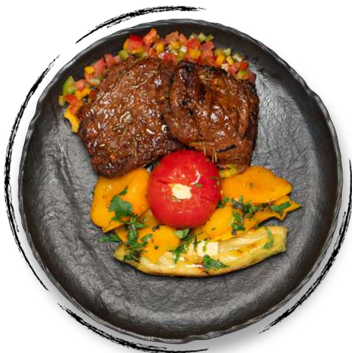
ЖАРЕНОЕ ФИЛЕ ГОВЯДИНЫ AMD 6200