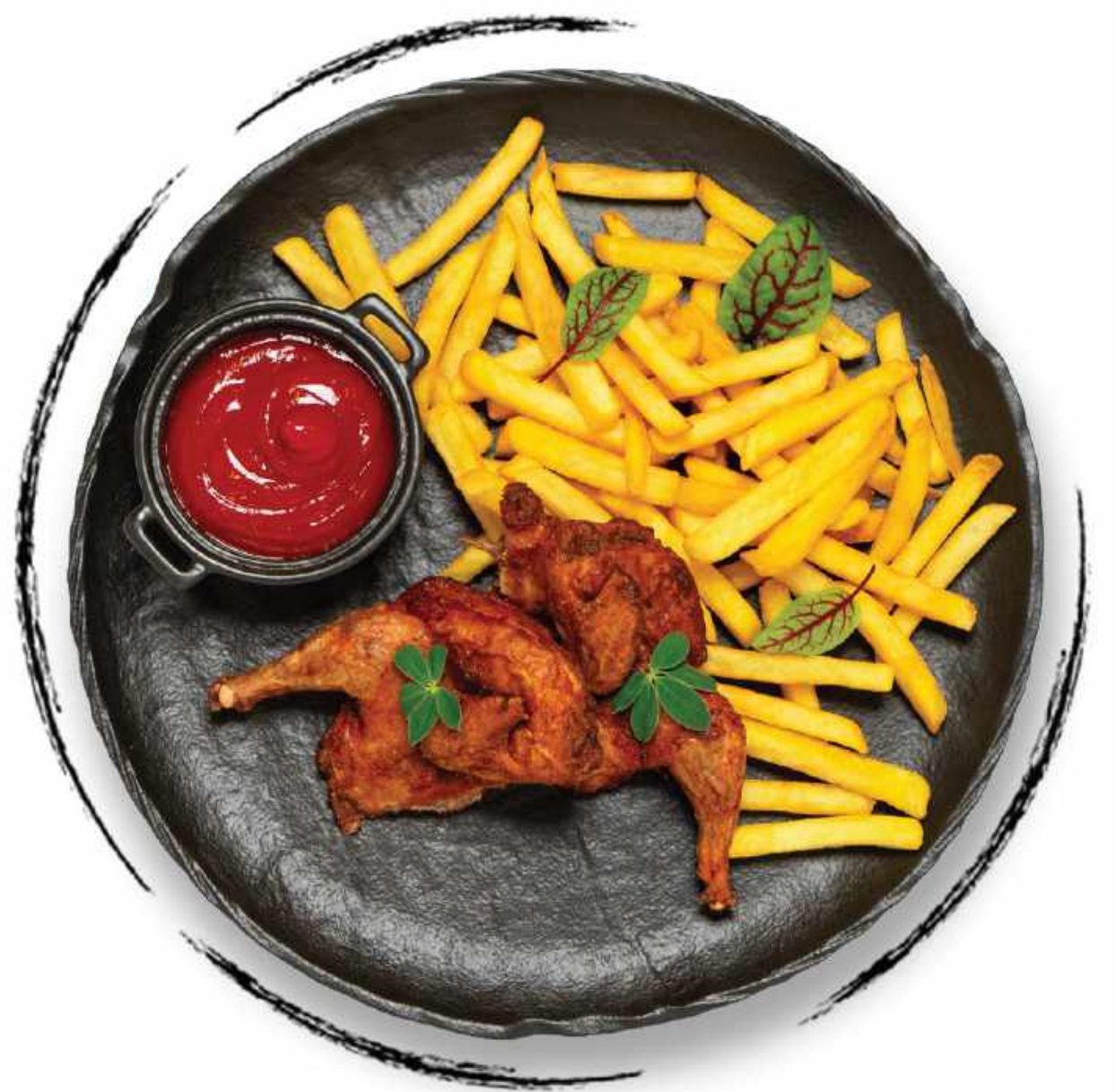
ЖАРЕННЫЙ ЦЫПЛЕНОК AMD 3200