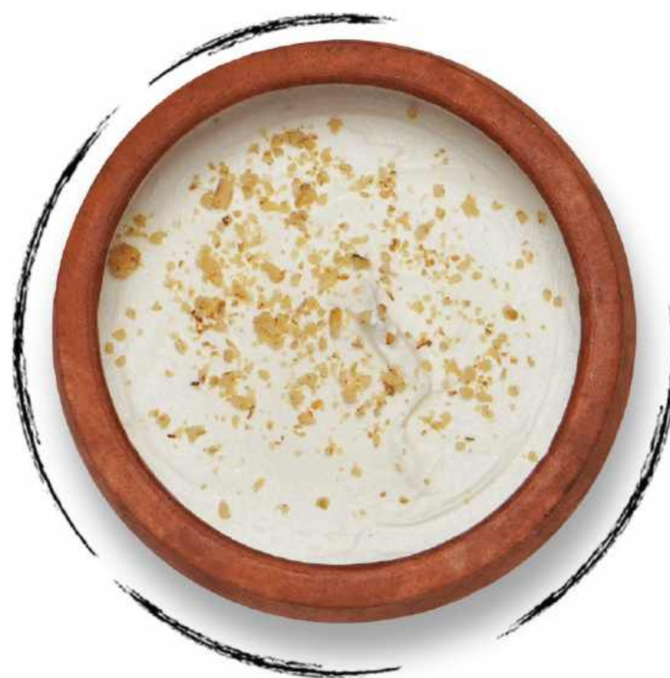
ՔԱՄԱԾ ՄԱԾՈՒՆ DRAINED MATSUN AMD 1700