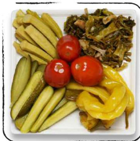
ԹԹՎԻ ՏԵՍԱԿԱՆԻ ASSORTED PICKLES/MARINADES AMD 2700