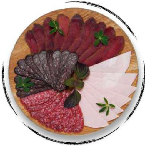
ՄԱՍՅԻՆ ԽՈՐՏԻԿՆԵՐ ASSORTED MEAT PLATTER AMD 4500