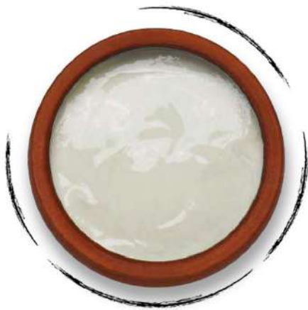
ՌԵԺԱՆ VILLAGE SOUR CREAM AMD 2300