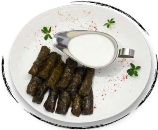
ԹՓՈՎ ՏՈԼՄԱ GRAPE LEAF TOLMA AMD 3700