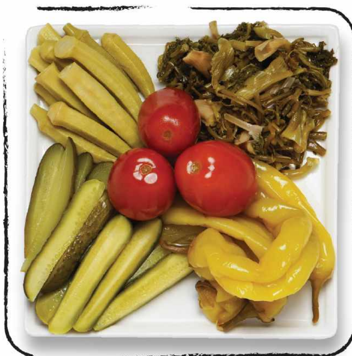
ԹԹՎԻ ՏԵՍԱԿԱՆԻ ASSORTED PICKLES/MARINADES AMD 2500