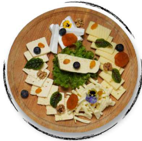
ՊԱՆԻ ՏԵՍԱԿԱՆԻ ASSORTED CHEESE PLATTER AMD 4500