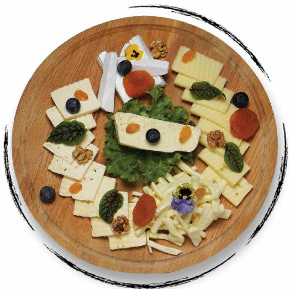
ՊԱՆՐԻ ՏԵՍԱԿԱՆԻ ASSORTED CHEESE PLATTER AMD 4200