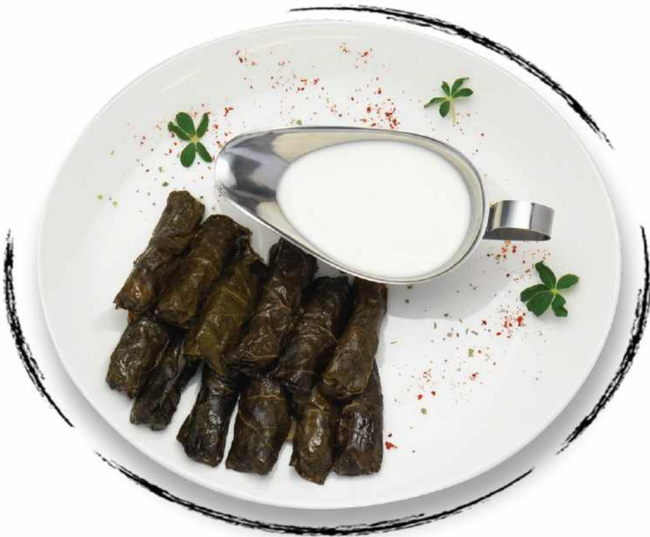
ԹՓՈՎ ՏՈԼՄԱ GRAPE LEAF TOLMA AMD 3500