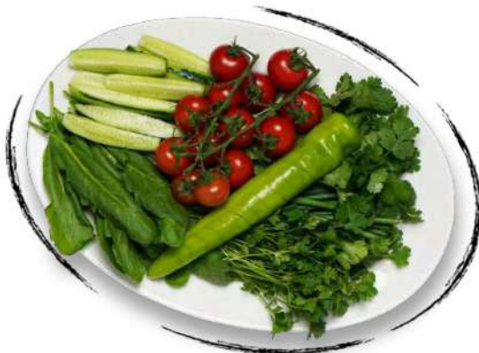
ԱՄԱՌԱՅԻՆ ՓՈՒՆՋ SUMMER BOUQUET AMD 4500