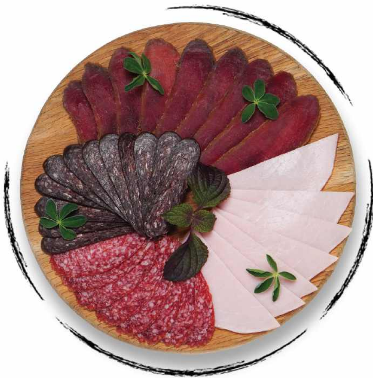
ՄԱՍՅԻՆ ԽՈՐՏԻԿՆԵՐ ASSORTED MEAT PLATTER AMD 4000