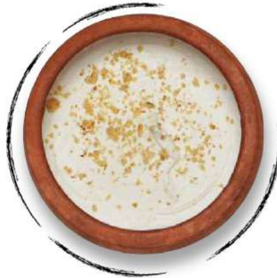
ՔԱՄԱԾ ՄԱԾՈՒՆ DRAINED MATSUN AMD 2000