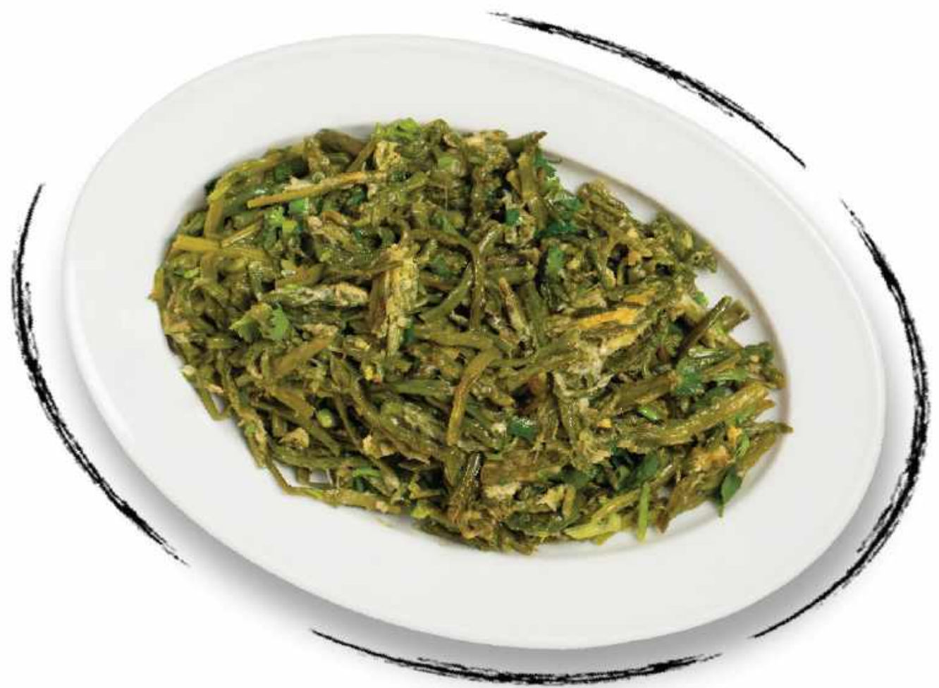
ՏԱՊԱԿԱԾ ԾՆԵԲԵԿ FRIED ASPARAGUS AMD 4000 / 2500