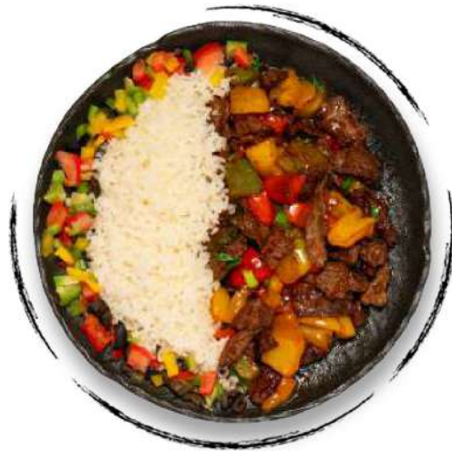
CHEF'S VEAL AMD 4700