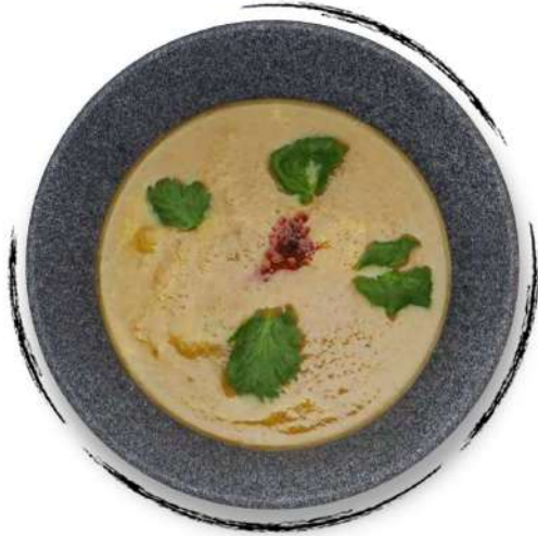
ՄՆԿՈՎ ԽՅՈՒՍ-ԱՊՈՒՐ MUSHROOM PUREE SOUP AMD 2500